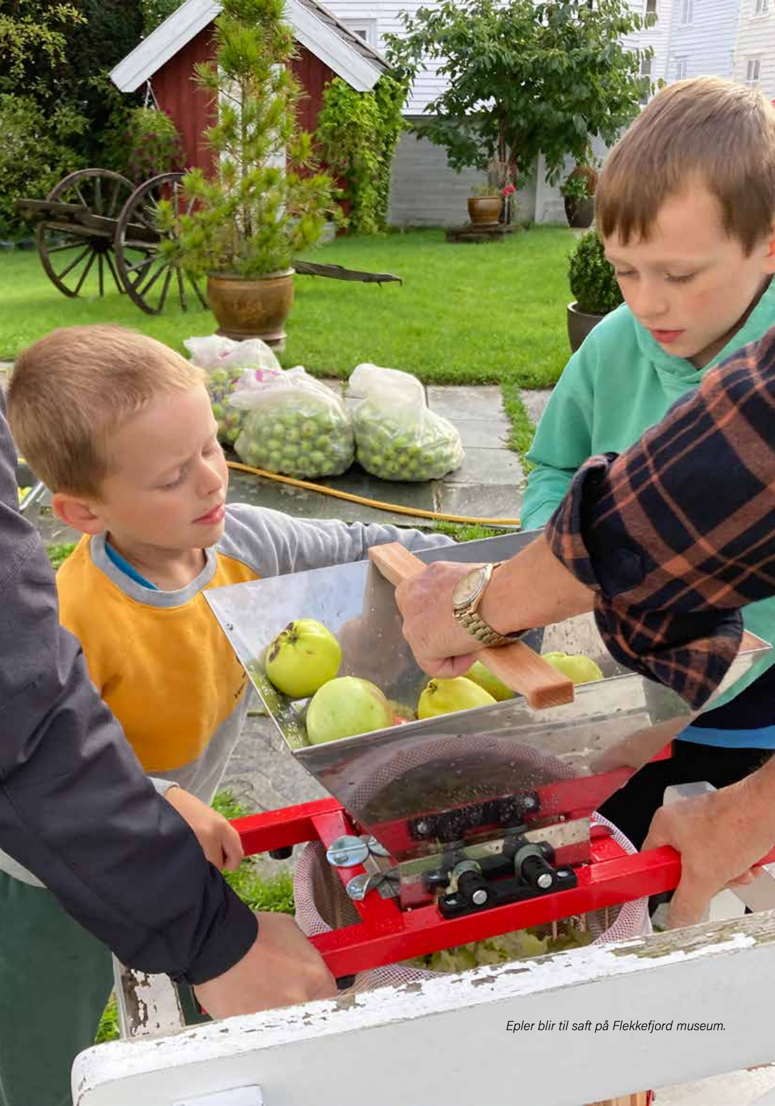
Epler blir til saft på Flekkefjord museum.