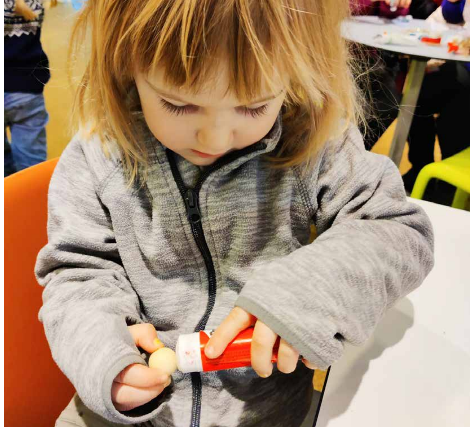
Barneaktiviteter på Lista museum.

Vest-Agder-museets eget delprosjekt i I-ON, «Det snakker vi ikke om! Familiehemmeligheter etter andre verdenskrig», har også hatt et aktivt driftsår i 2023. Vandretstillingen har besøkt tre av våre egne avdelinger samt Stiklestad nasjonale kultursenter og formidles til ungdomsskoleklasser gjennom Den kulturelle skolesekken i hele Agder. Arbeidet med «Det snakker vi ikke om!» har bidratt til et oppfølgende