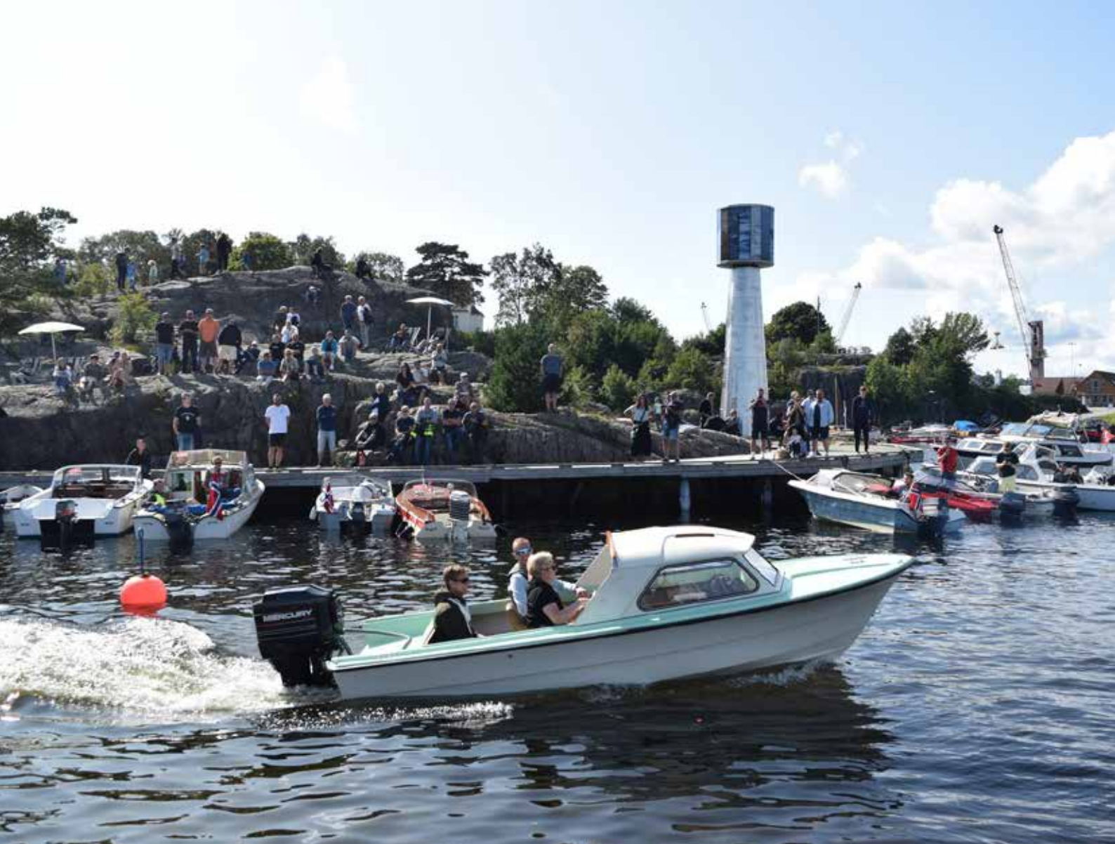
“Plastikk 2023” i Odderøya museumshavn.