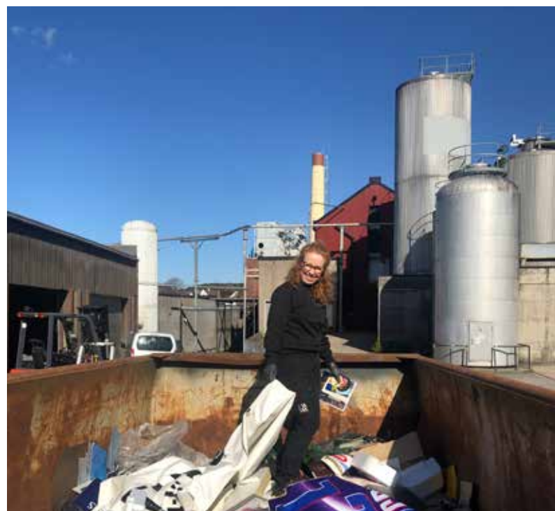
Samlingsforvaltning roter bokstavelig talt i søpla etter gjenstander på CB.