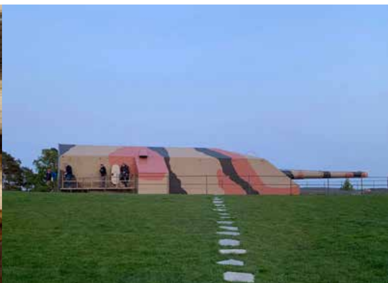
Kveldsvandring på Kristiansand kanonmuseum.