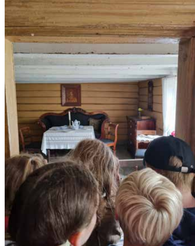
Skoleelever på besøk på Kristiansand museum.

Museet er en sentral samarbeidspartner for den fylkeskommunale kulturelle skolesekken (DKS) på kulturarvfeltet og tilbyr også noen opplegg innen visuell kunst. Den enkelte avdeling samarbeider med sin