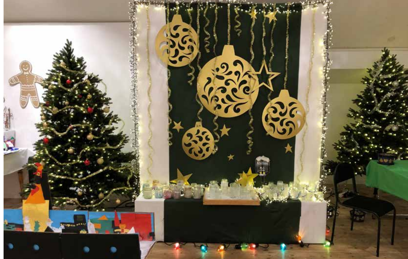
Juleutstilling 2023 på Flekkefjord museum, laget av barnehage- og skolebarn.

Vest-Agder-museet tar ansvar i forhold til å bekjempe misligheter og korrupsjon, og for å bidra til anstendige arbeidsforhold og menneskerettigheter både i egen virksomhet og hos sine leverandører. Gjennom sine retningslinjer, rutiner og risikovurderinger arbeider museet for å minimere risikoen for misligheter ifm. museets drift. For å bidra til FNs bærekraftsmål om