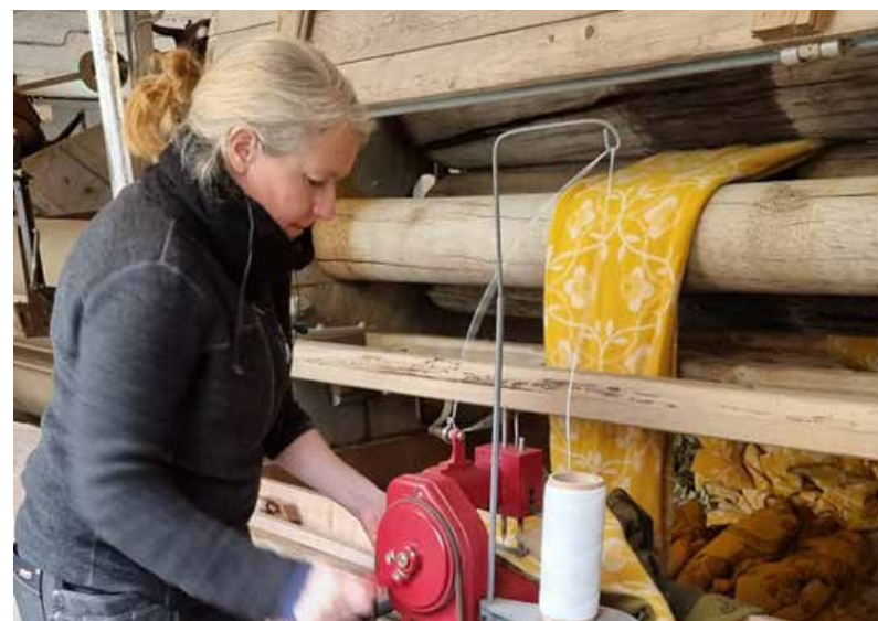
Åpen fabrikk på Sjølingstad Uldvarefabrik.