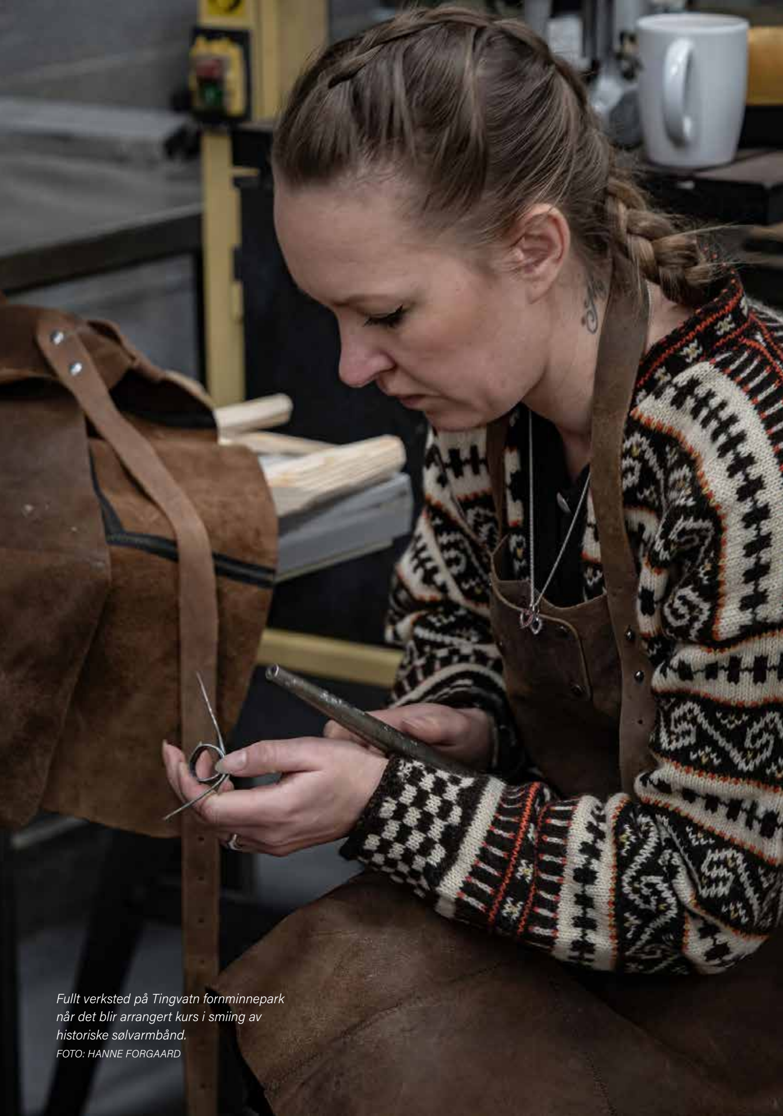
Fullt verksted på Tingvatn fornminnepark når det blir arrangert kurs i smiing av historiske sølvvarmbånd.