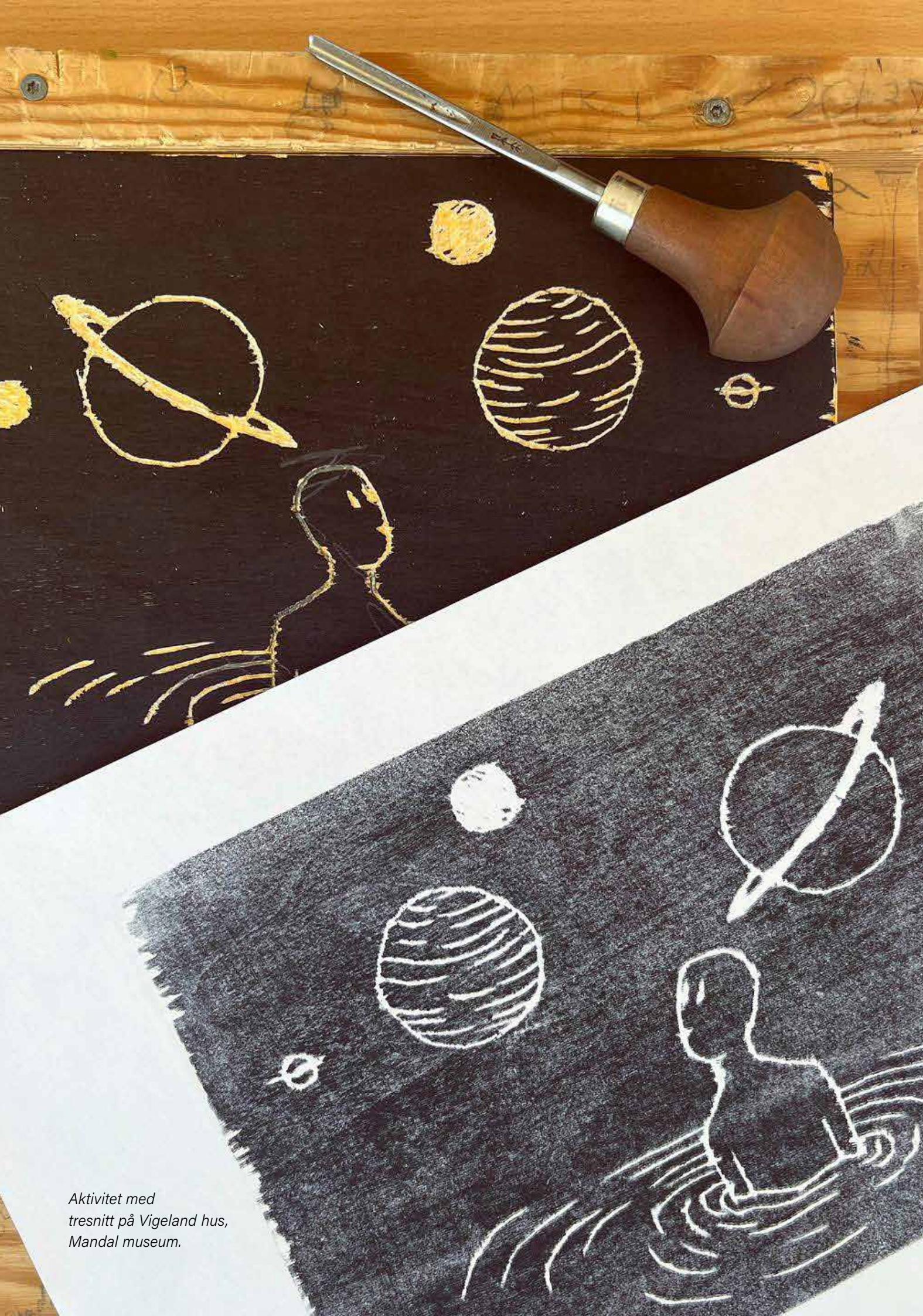
Aktivitet med tresnitt på Vigeland hus, Mandal museum.