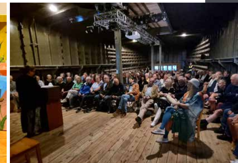
Seaweed-festivalen i Odderøya museumshavn.