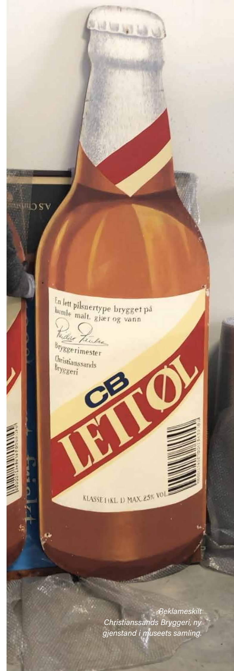
Reklameskilt Christianssands Bryggeri, ny gjenstand i museets samling.

Styret har gjennom året blitt holdt informert om virksomhetens økonomiske situasjon og økonomistyring, samt om den løpende driften av Vest-Agder-museet.