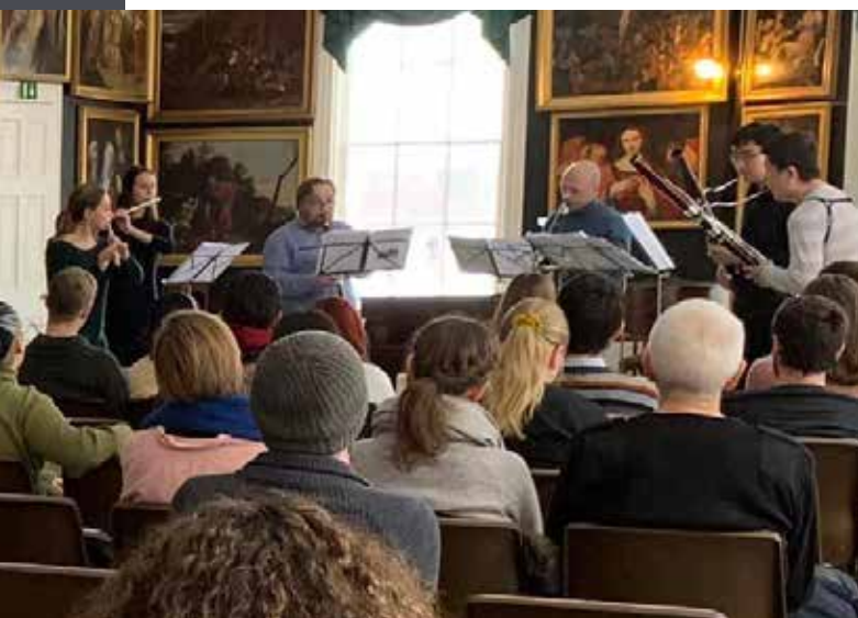
Konsert med UiA-studenter på Gimle Gård.