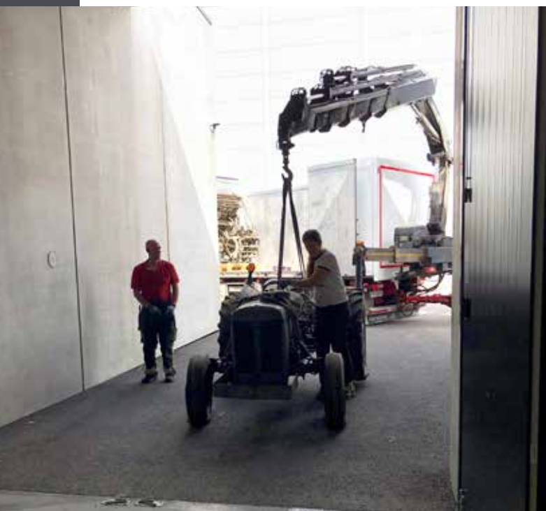
Gråtass flyttes til nytt magasin, med kranbil.