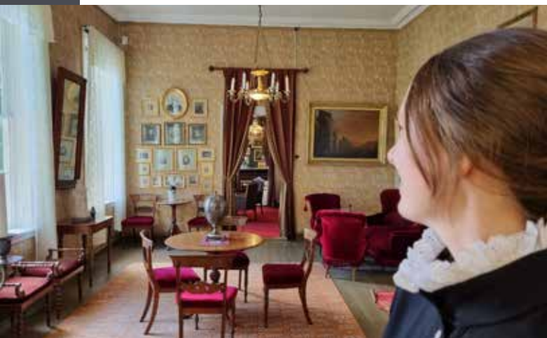
Foredrag: Et kolonialistisk blikk på Gimle Gård