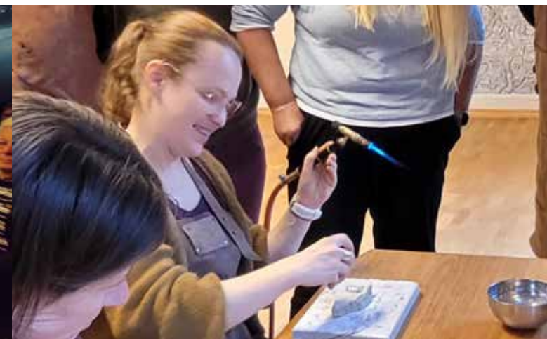
Kurs i sølvarbeid på Tingvatn fornminnepark.