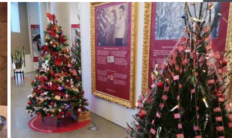
«Historisk juletreutstilling» i Rådhuskvarartalet.