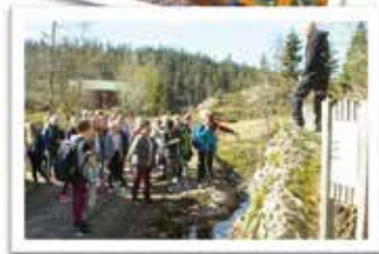
Det Gamle Posthuset og barnevandringstraseen.