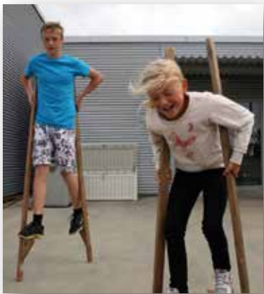
Mange aktiviteter på Nordberg fort.

Museet er gratis for barnehager og skoler.