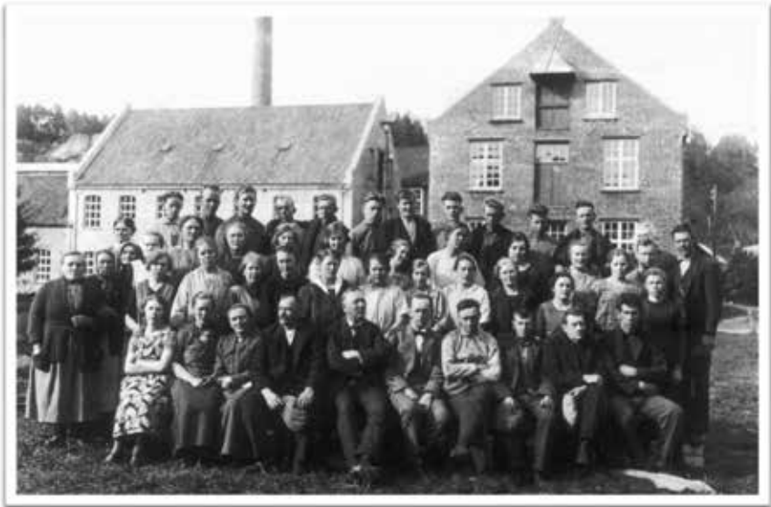
Fabrikkarbeidere ved Sjølingstad Uldvarefabrik.

produserer og selger garn, kardedet ull og hobbyfilt i mange farger. Dette passer godt til juleverksted og kunst og håndverk.