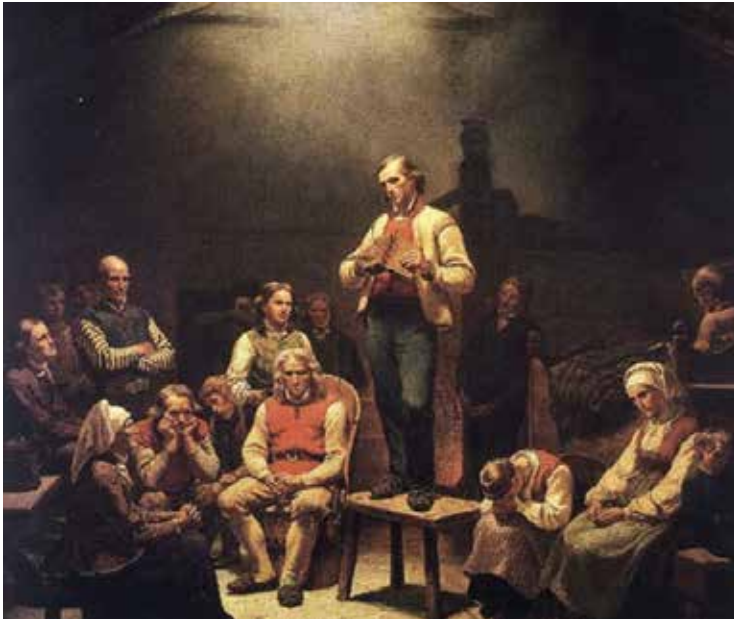
Adolph Tidemand, "Haugianerne", Mandal museum.

Gustav og Emanuel Vigelands barndomshjem. Huset har to etasjer og loft. Det ble brukt som kombinert møbellager, kontor og bolig. Anlegget omfatter også sørvisbygg, fjøs/stall, en liten skulpturhage og verksted/galleri. Mulighet for å spise matpakker ute i hagen.