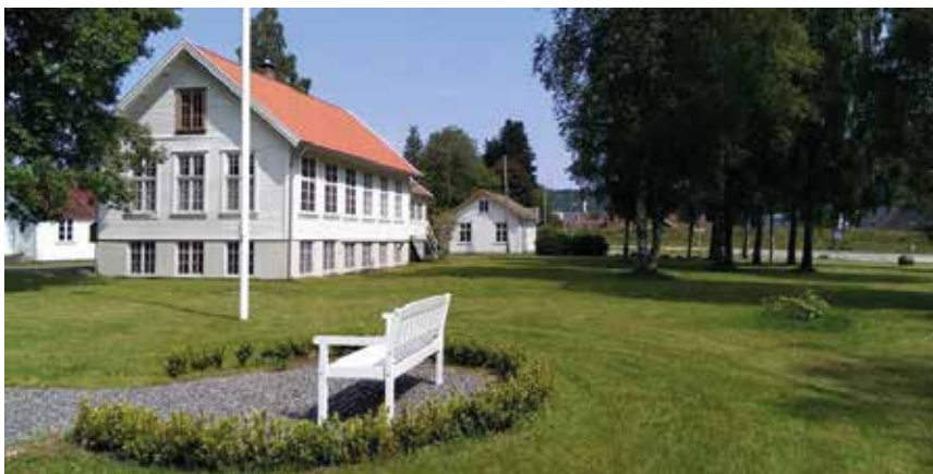
Klokkergården bygdetun.