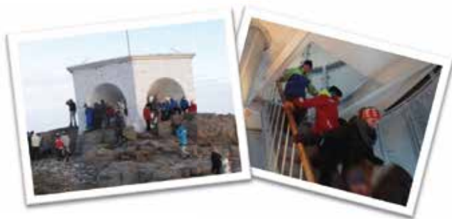
Den kulturelle skolesekken på Lindesnes fyr.

Legg et besøk til Norges sydspiss og Lindesnes fyr, Norges første fyrstasjon. Lindesnes fyrmuseum er en del av Kystverkmusea og tilbyr formidling innen temaene kystkultur, fyrhistorie, meteorologi og navigasjon. Museet er også ansvarlig for tjenesten www.kystreise.no . Lindesnes fyr ligger i et naturskjønt landskap. Området byr på oppmerkede turstier og spennende naturopplevelser.