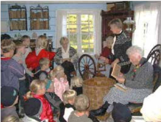
Den kulturelle skolesekken på bygdemuseet i Vennesla.