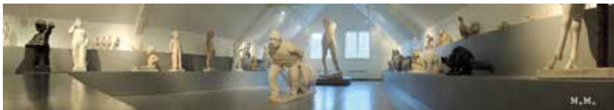
Sigurd Nomes skulptursamling på Høgtun i Marnardal.

Kontakt museet for bestilling av omvisninger. Museumsbesøk er gratis for skoler og barnehager.