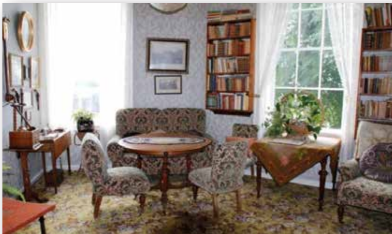
Interiør fra Gimle Gård herregårdsmuseum.

Omvisninger mellom august – november og mai – juni. Jul på Gimle alltid uken før 1. søndag i advent. Omvisninger og undervisning ved Gimle Gård er gratis for skoler og barnehager. Maks 20 personer i hver gruppe om ikke annet er avtalt.