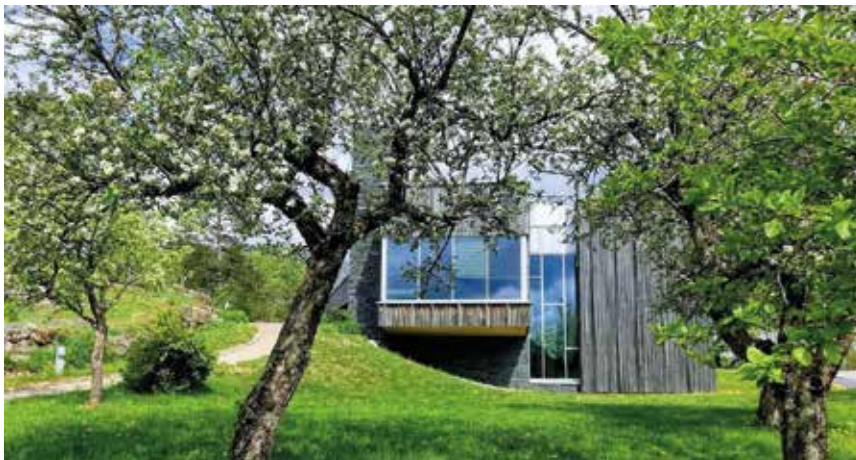
Minne Åseral kultursenter. Tor Reidar Austrud.

Kontaktperson: Tor Reidar Austrud, tlf. 38 28 58 60, 928 44 735, e-post: tra@aseral.kommune.no