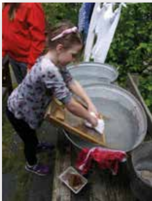
Storvask på Porsmyr Bygdetun.

E-post: beundis@online.no www.porsmyrbygdetun.com