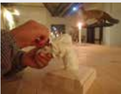
Modellering i verkstedet på Kulturtorvet.

Kontakt: Lindesnes kommune, tlf: 38 25 51 00 eller Hanne Thyholdt, tlf. 38 25 51 11/ 994 41 160. E-post: hth@lindesnes.kommune.no