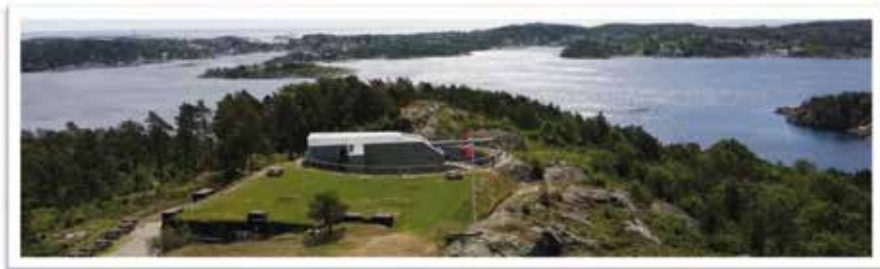
Kanonmuseet på Møvik fort.

I flott turterreng på Møvig utenfor Kristiansand ligger et kanonbatteri fra andre verdenskrig. Kanonen på Møvig er verdens nest største kanon noensinne montert på land, og den er av samme type som kanonene på de tyske slagskipene Bismarck og Tirpiz. Batteriet på Møvig ble påbegynt i 1941 og skulle sammen med kanonbatteriet i Hanstholm kontrollere skipstrafikken i Skagerrak. Du finner også mindre kanoner, en stor utstilling i en kanonbunker og en ammunisjonsjernbane. Våren 2020 åpner ny utstilling i sambandsbunkeren og installasjoner i kasematten.