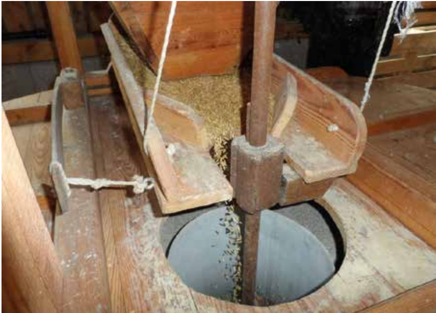
Mølla i gang på Hægeland Bygdemuseum.

Omvisning gis og planlegges i samarbeid med lærer. Tilbudene er gratis for skoleklasser og barnehager.