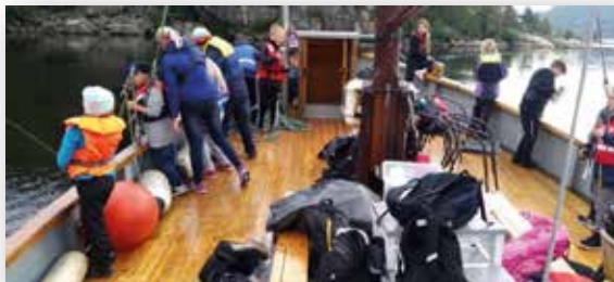
På tur med Solstrand.

Følg oss på: facebook.com/Flekkefjordmuseum Instagram: flekkefjordmuseum_krambua