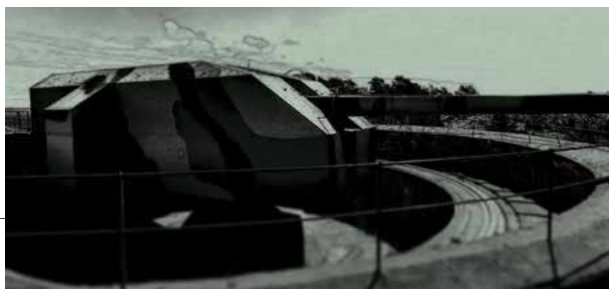
Kveldsvanring på Kristiansand kanonmuseum