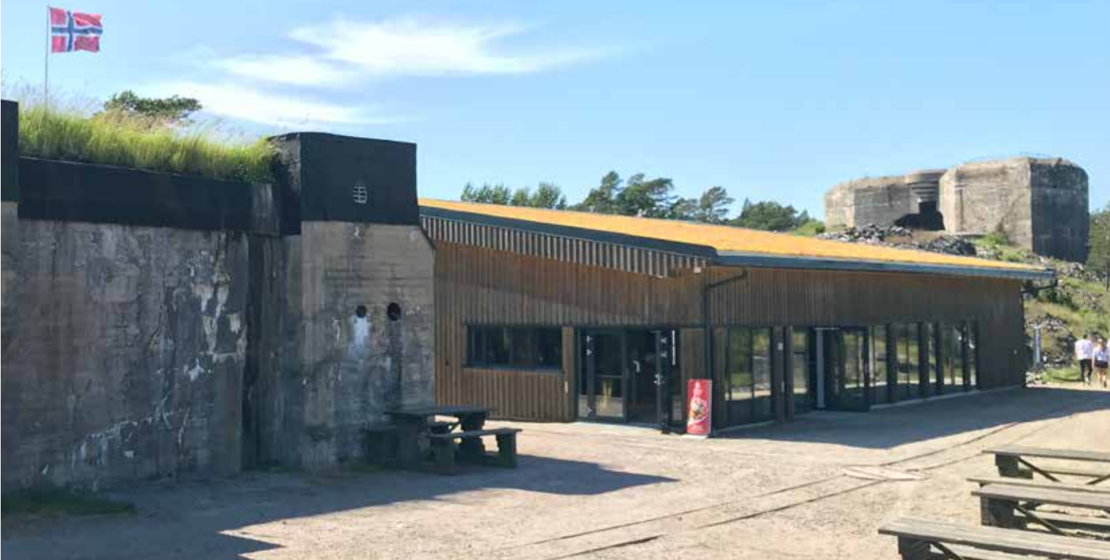
Nytt publikumsbygg på Kristiansand kanonmuseum

Videre ble Vest-Agder-museets prosjekt «Sammen om fortellingen – lokalt og internasjonalt», som ble støttet av Kulturrådet gjennom samfunnsrolleprogrammet (2018–2021), avsluttet i 2021. Målet med prosjektet var å forankre samfunnsrollen internt i museet og å åpne opp for inkludering og involvering av eksterne, noe vi mener å ha nådd.