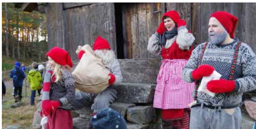
Julemarked på Kristiansand museum