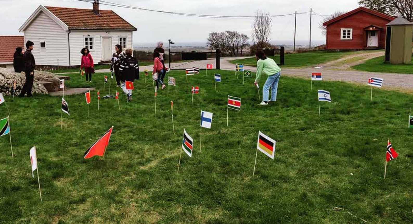
FN markering med dans, musikk, mat, diktlesning og eventyr