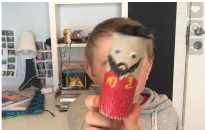
Fra filmen #innstengt