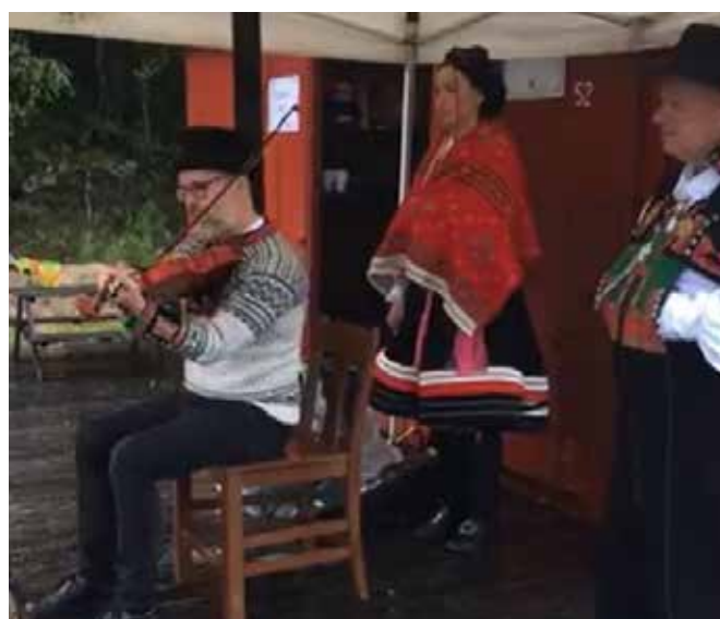
Fra Setesdalsbanens jubileumshelg