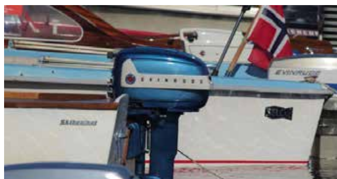
Plastikk 2021. Rebusløp for klassiske plastbåter