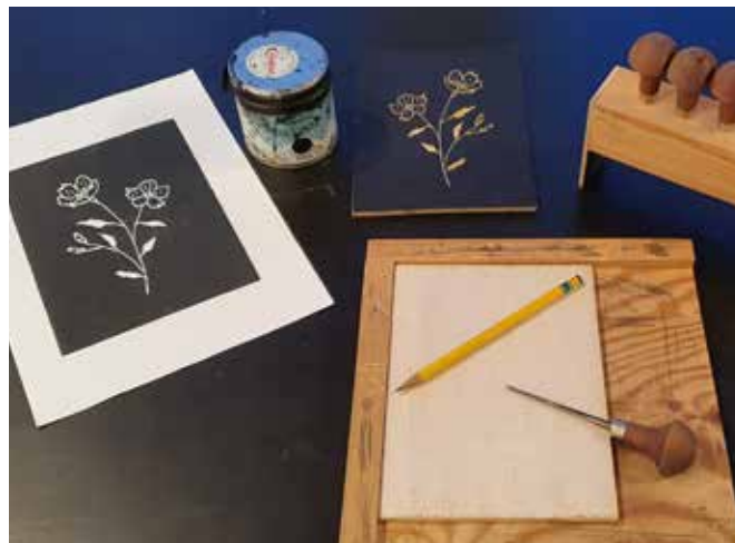
Høstferieaktiviteter på Mandal museum