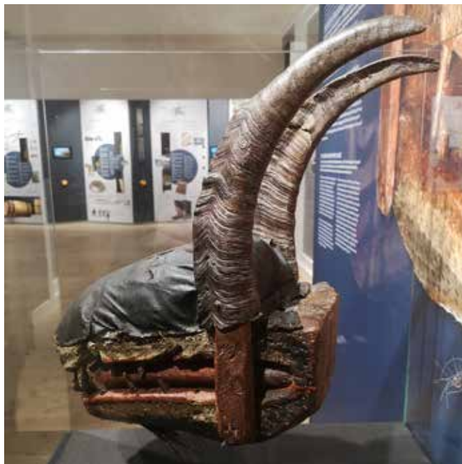
«Julegeita fra Sunde» hjemmehørende på Flekkefjord museum