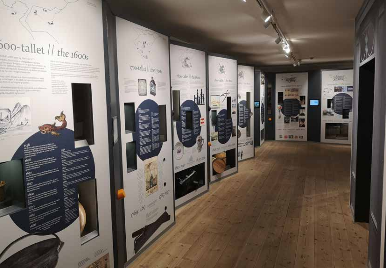
Ny lokalhistorisk utstilling på Flekkefjord museum

for Vest-Agder-museet. Revisor fra Agder kommunerevisjon deltok i styremøtet 25. februar 2021 under behandlingen av årsregnskap og styrets årsberetning 2020.