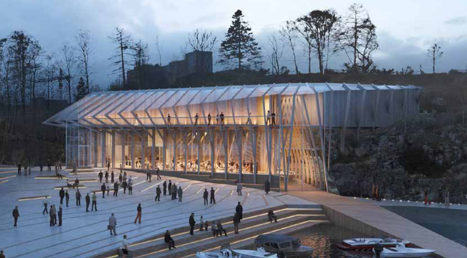
Planene for nytt museumsbygg i Noddeviga på Odderøya (ill.: arkitektfirma Helen & Hard)