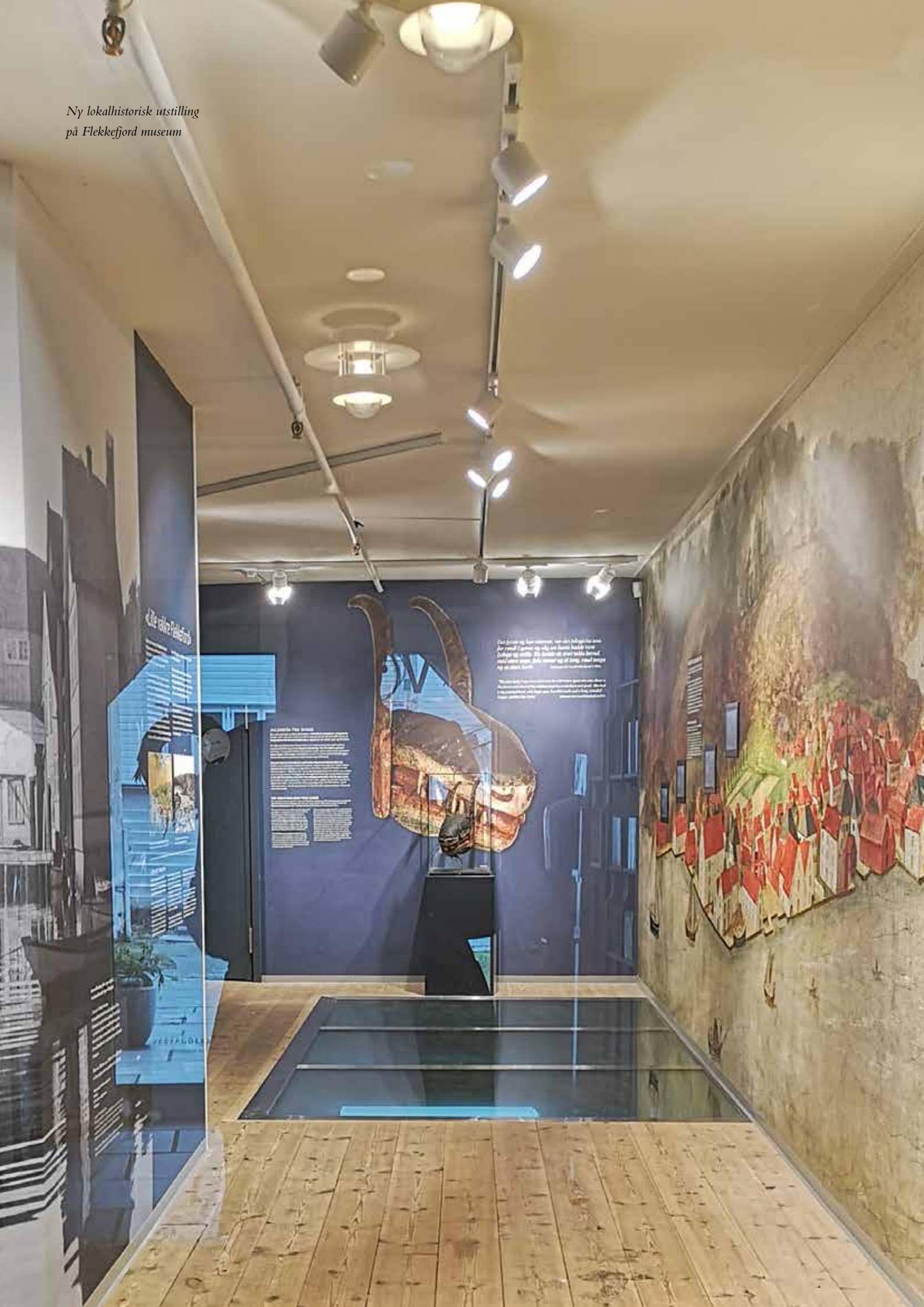
Ny lokalhistorisk utstilling på Flekkefjord museum