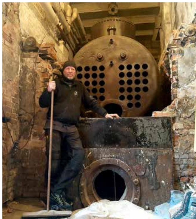
Den gamle fyrkjelen på plass i fyrrommet på Sjølingstad Uldvarefabrik