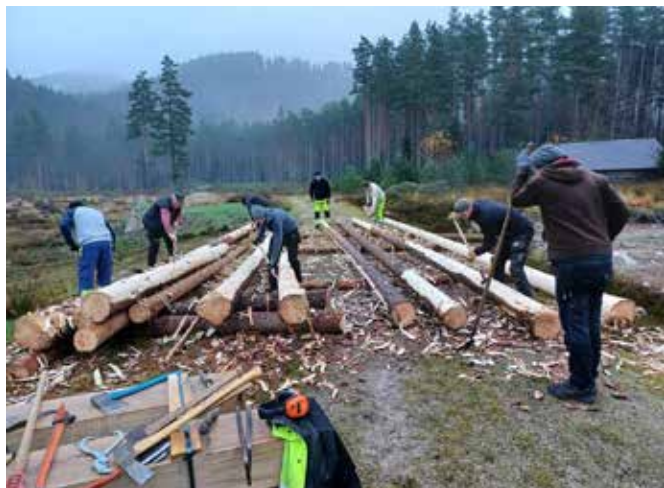
Fra avbarking av tømmer til nytt «mathus» på Tingvatn