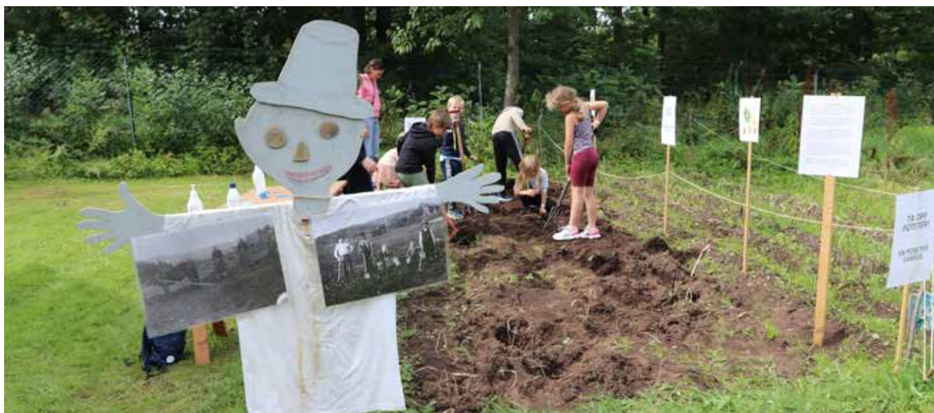
Potetdag på Kristiansand museum

ferdigstilt i 2021 gjennom de lokalhistoriske utstillingene i Mandal og Flekkefjord. Elever har vært involvert som innholdsleverandører, både som aktive intervjuere, som intervjuobjekter og i formidlingen.