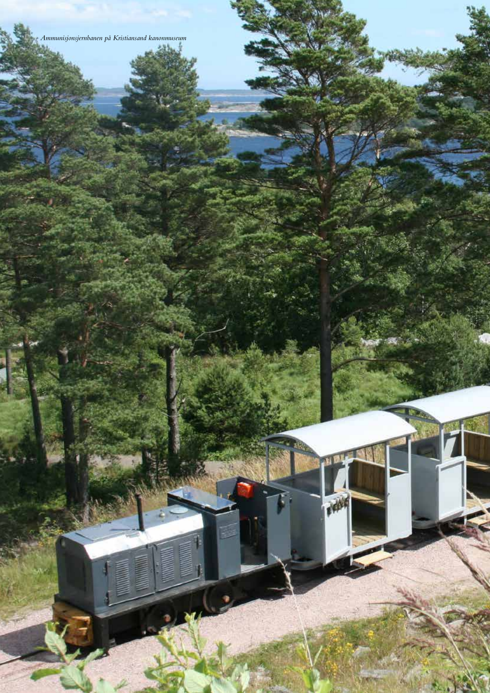
Ammunisjonsjernbanen på Kristiansand kanonmuseum