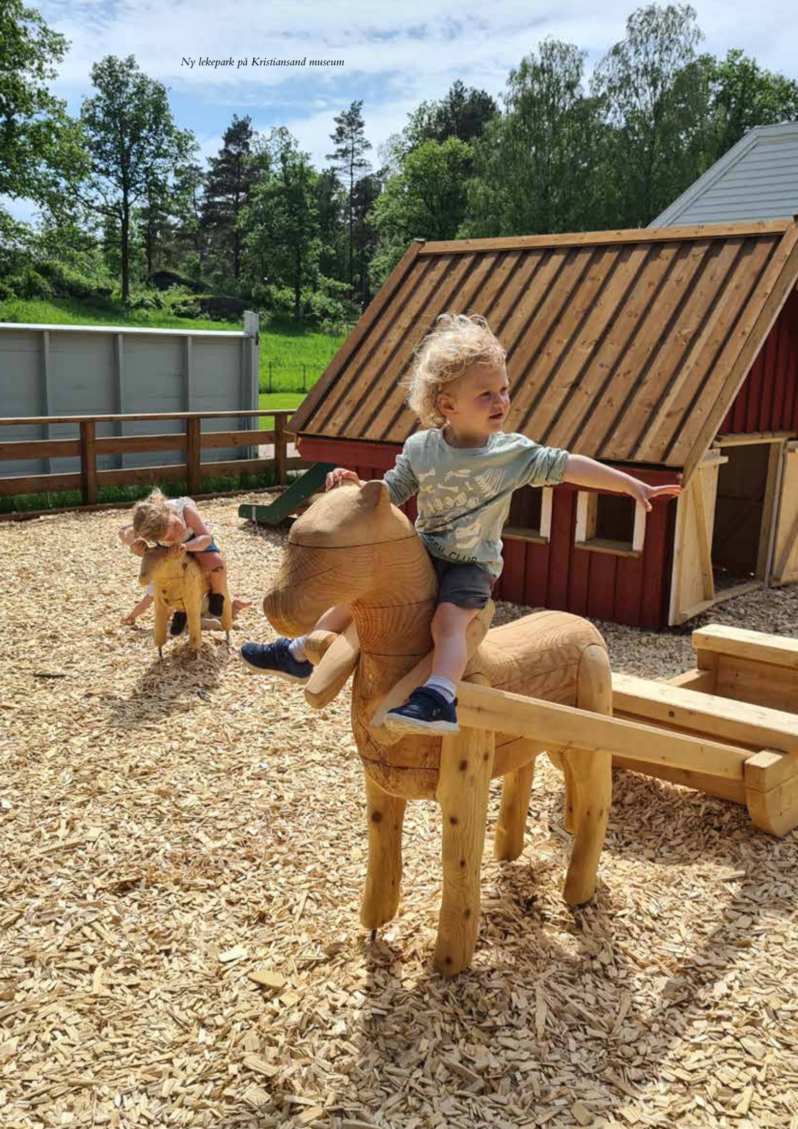
Ny lekepark på Kristiansand museum