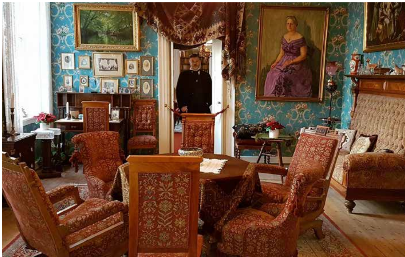
En av salongene på Gimle Gård