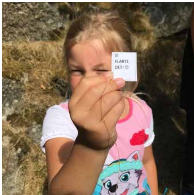
Skattejakt på Nordberg fort