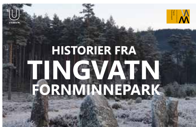
Skiltfri audiovisuell omvisning på Tingvatn fornminnepark