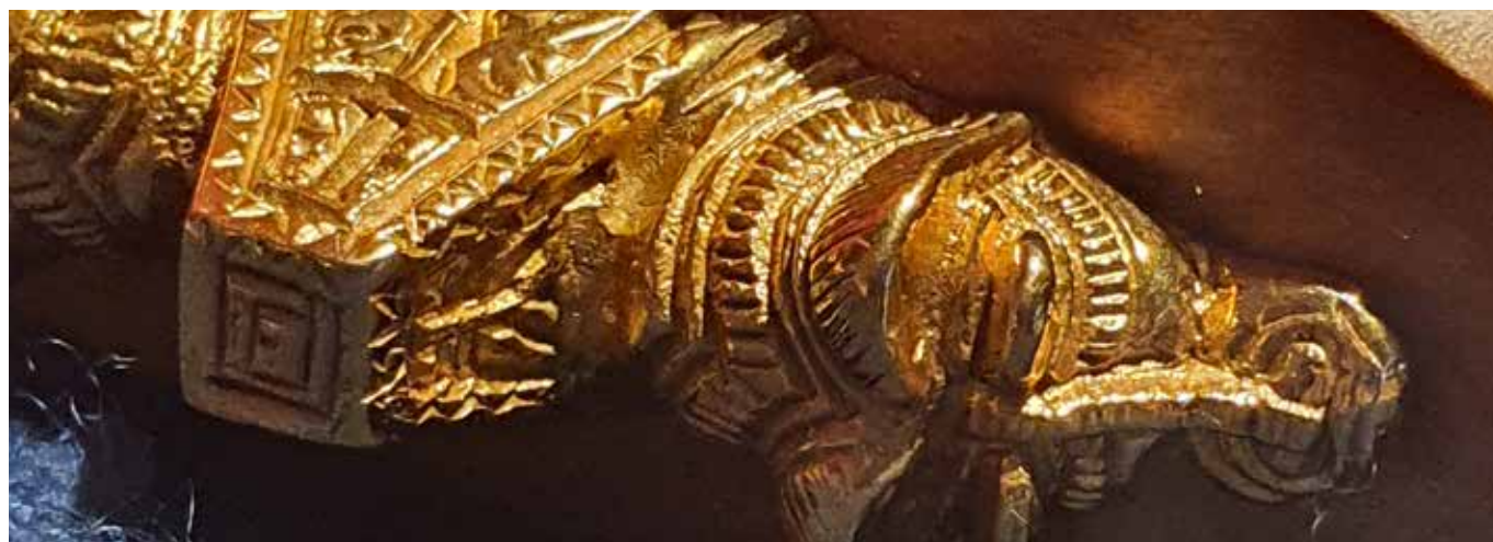
Tingvatn forminnepark har samarbeidet med frivillige om rekonstruksjon av Snartemo II-sverdet

Investeringene knytter seg i hovedsak til ferdigstilling av nytt publikumsbygg på Kanonmuseet, herunder også parkeringsplass og tekniske anlegg. Det er også utført vesentlige reparasjon- og vedlikeholdsarbeider på Kristiansand museum, Setesdalsbanen og Hestmanden. En del av investeringsprosjektene var i utgangspunktet definert som driftsprosjekter, noe som medfører avvik mellom det som opprinnelig var budsjettert som investeringer og hva som faktisk er regnskapsført av investeringer. Dette gir også avvik i hva som er budsjettert som avsetninger til investeringsfond i forhold til hva som faktisk er avsatt til investeringsfond.