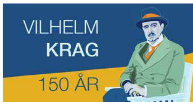
Foredrag om Vilhelm Krag, 150-årsjubileum