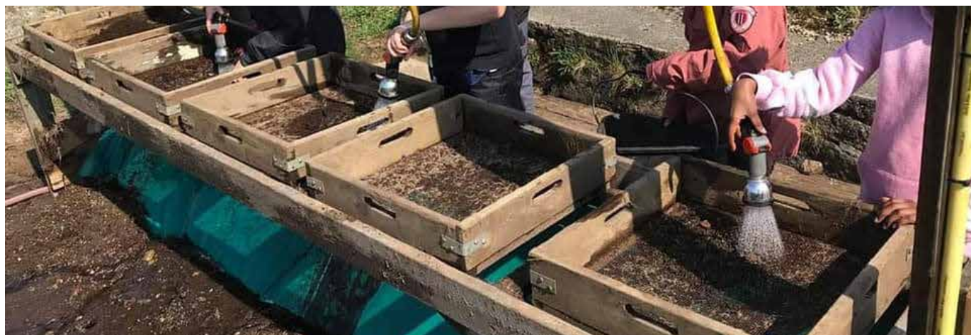
Arkeolog for en dag – Lista museum