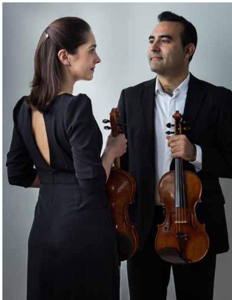
Duo White hadde konsert på Gimle Gård.

egeninntjening, både gjennom økt besøk, økt mersalg til besøkende og gjennom støtte fra stiftelser og fond.