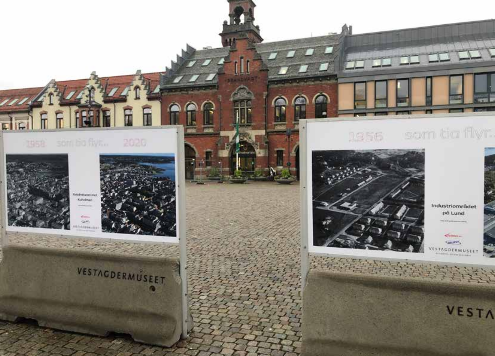
Utstillingen "Som tia flyr" på torvet i Kristiansand, Agderbilder.

Det har vært avholdt 7 ordinære styremøter, to av disse ble avholdt på Teams. Totalt har 55 saker blitt behandlet.