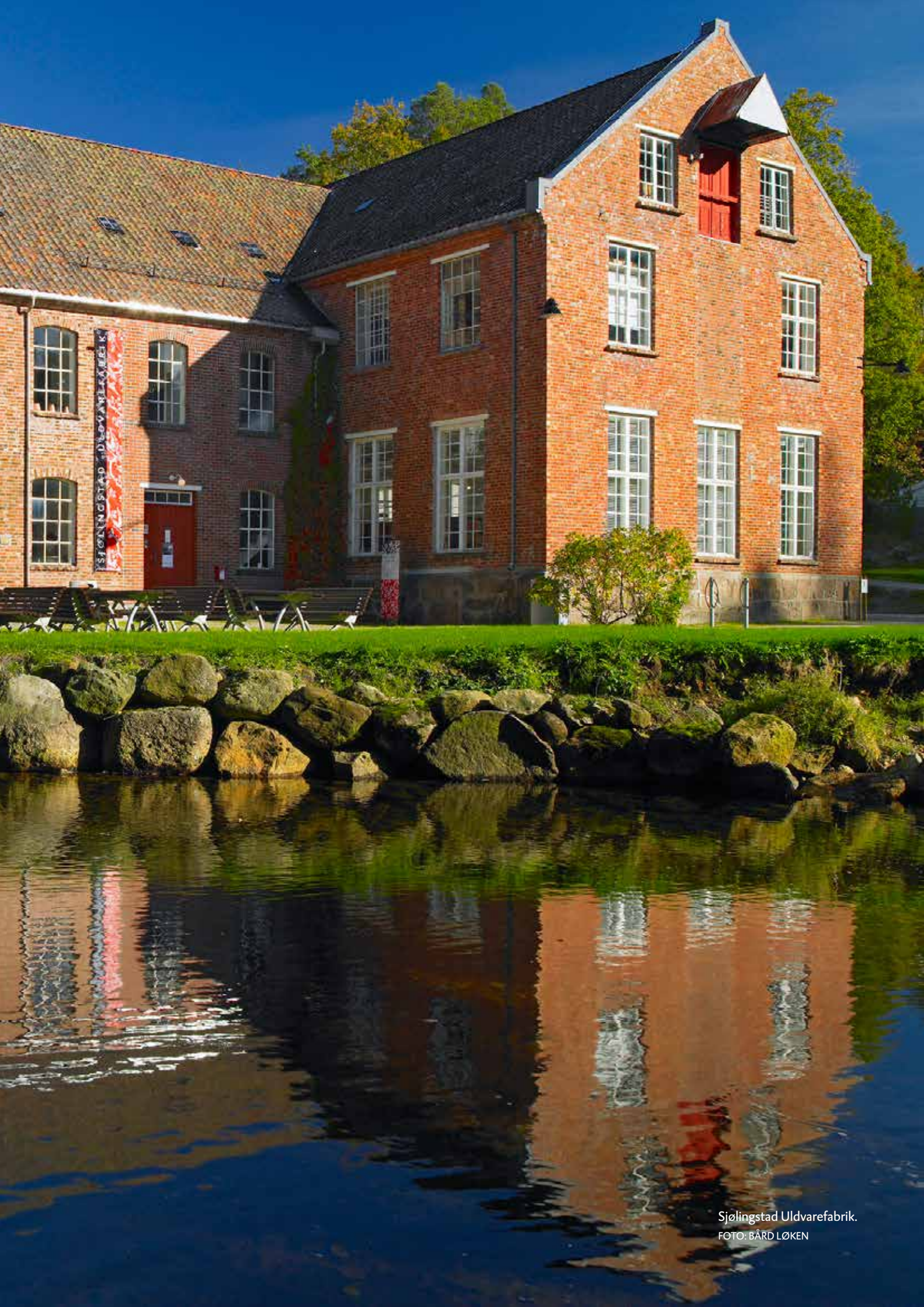
Sjølingstad Uldvarefabrik.