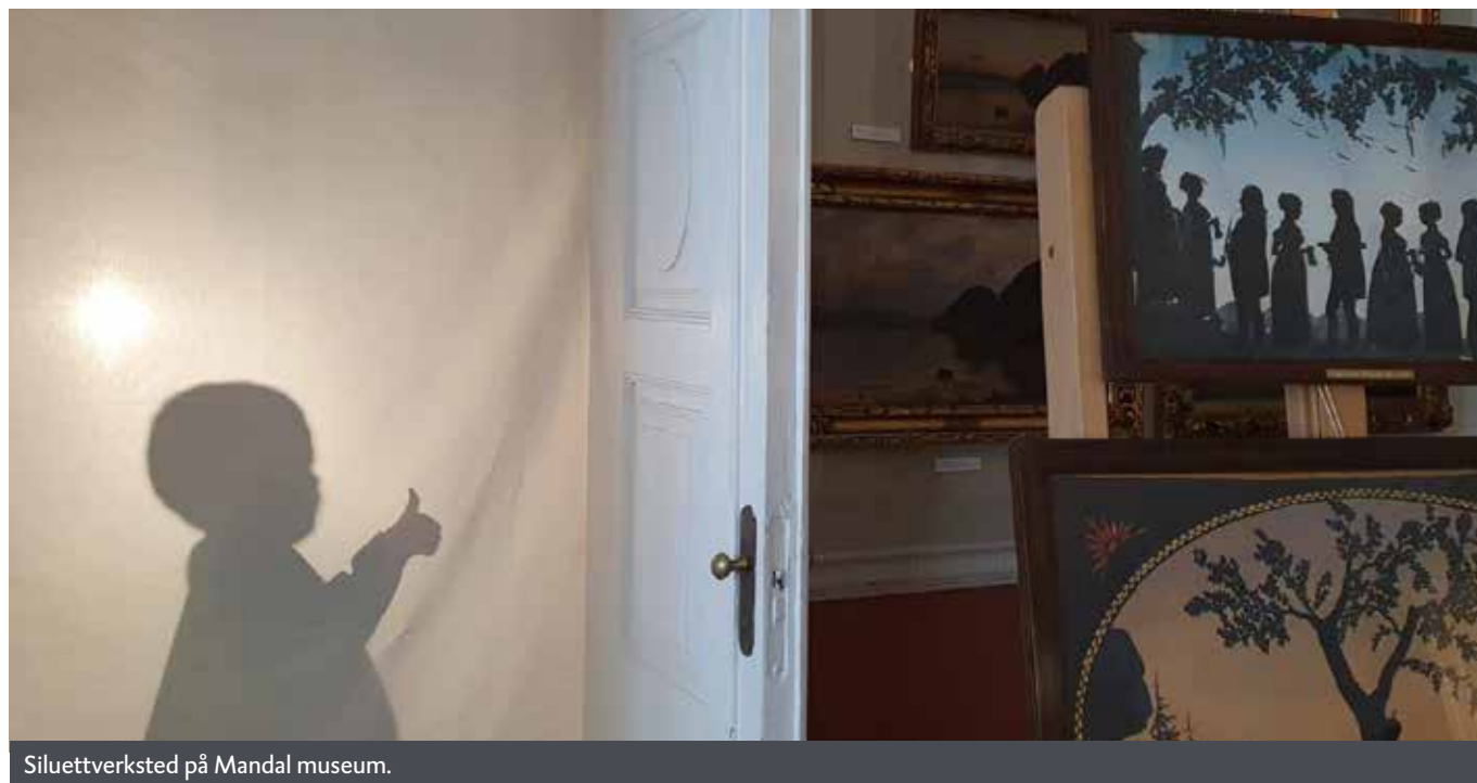
Silueverksted på Mandal museum.