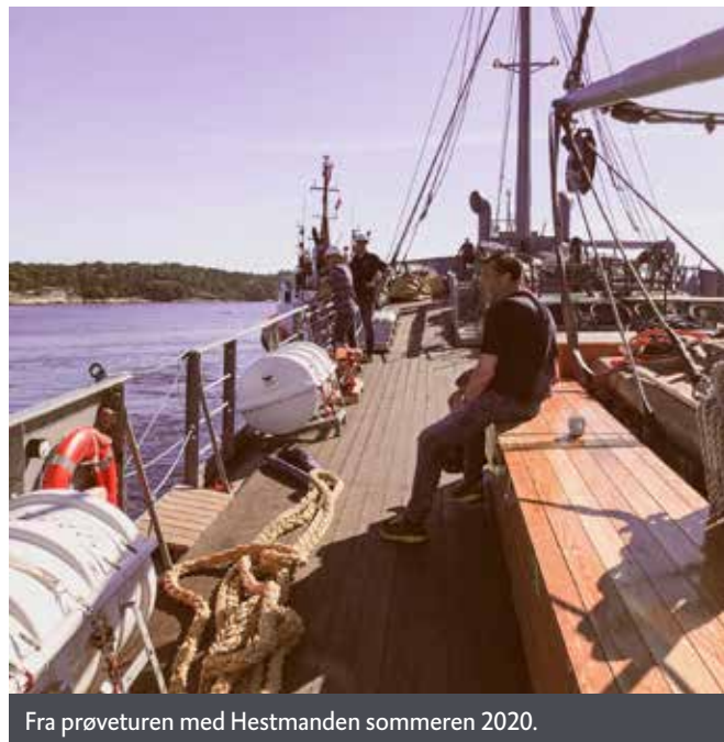
Fra prøveturen med Hestmanden sommeren 2020.

Smittevernet hadde høy prioritet ved alle avdelinger. Ved Gimle Gård og D/S Hestmanden ble det for krevende å holde åpent, og det planlagte landsdekkende jubileumstoktet til Hestmanden måtte utsettes til 2021. Setesdalsbanen gjennomførte hele sesongen med halv kapasitet på hver kjøring. Til tross for at alle avganger var utsolgt, ble antall reisende redusert med 65 % sammenliknet med 2019. Bortfallet av skoleklasser, cruiseturister og andre gruppebesøk var merkbart for de fleste av Vest-Agder-museets besøksmål, men ikke minst ga avlysningene av de store publikumsarrangementene utslag i besøksstatistikken. Julemarkeder, familiedager og andre signaturarrangementer for enkeltavdelinger er viktige møtesteder for lokalbefolkningen og tilreisende gjester, men lot seg ikke gjennomføre i 2020. Smitteverntiltakene førte imidlertid til at museene måtte legge om enkelte rutiner og prøve ut nye former for arrangementer, omvisninger og publikumsflyt, noe som har gitt nyttig lærdom, også med tanke på drift i normalår.