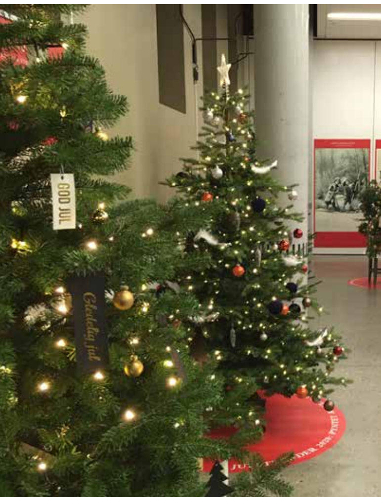
Juletreutstilling i Rådhuskvartalet i Kristiansand.