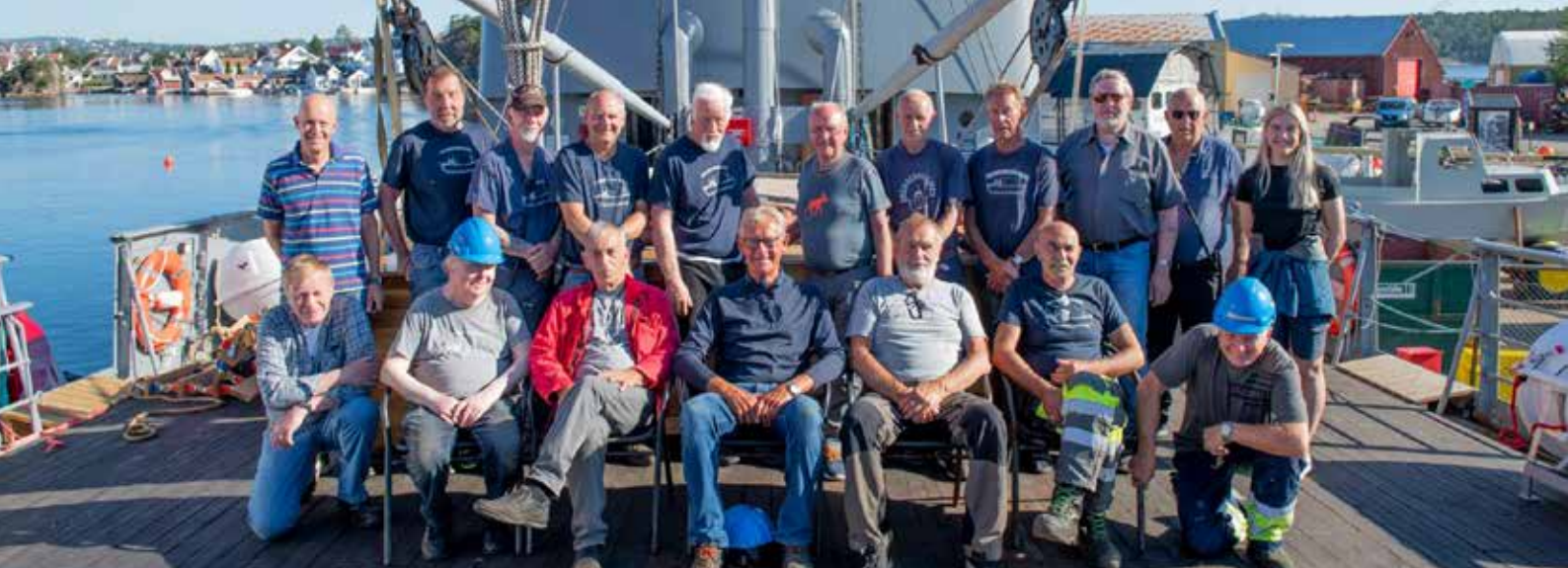
Fra prøveturen med Hestmanden sommeren 2020.