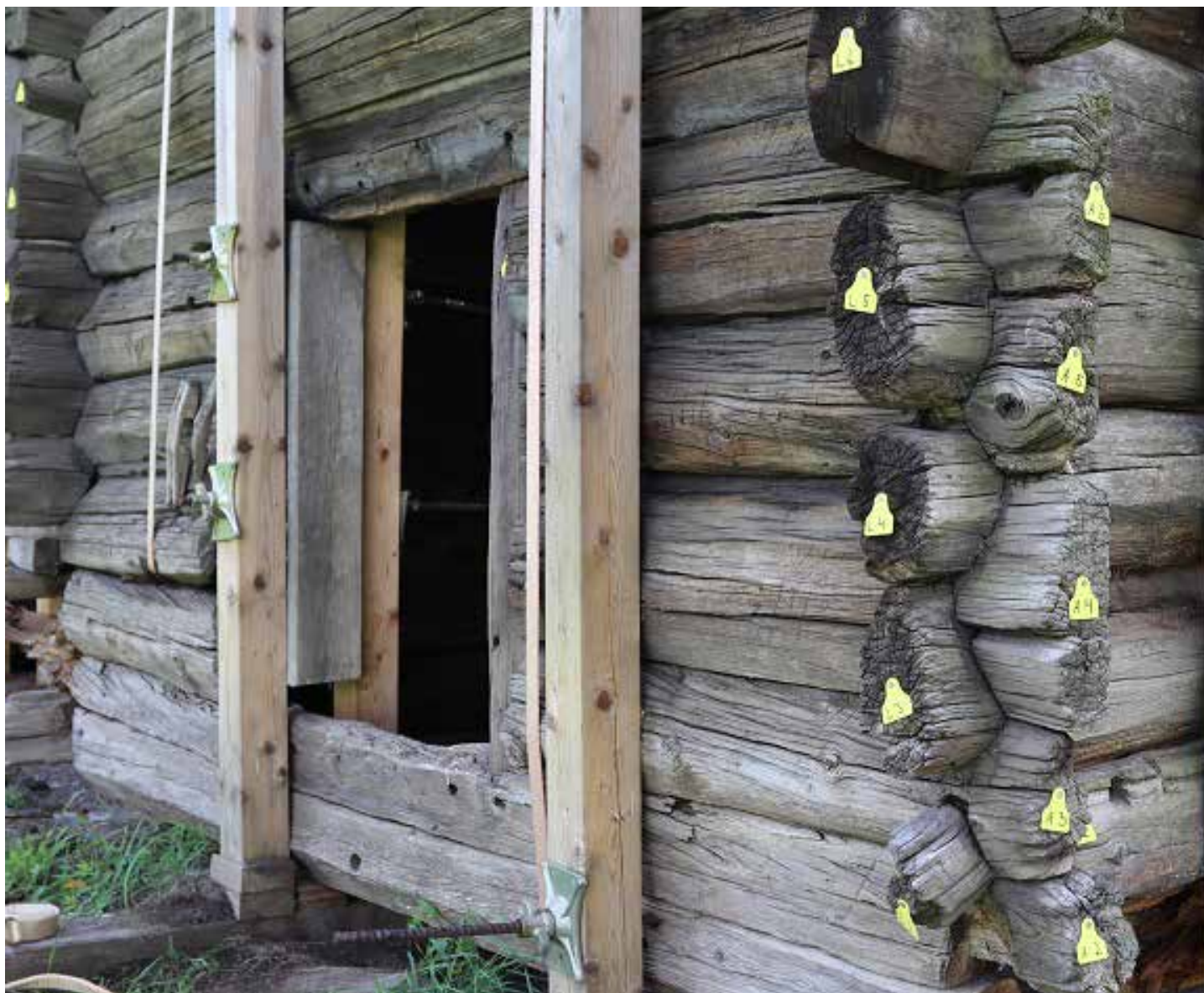
Sommeren 2020 startet arbeidet med istandsetting av løa på Kristiansand museum.