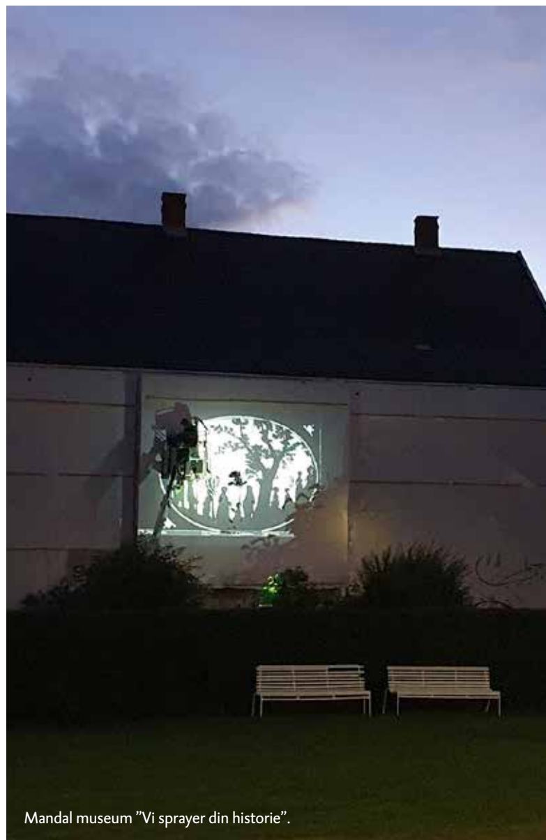
Mandal museum "Vi sprayer din historie".

Vest-Agder-museet er en sentral samarbeidspartner for den fylkeskommunale kulturelle skolesekken (VAF-DKS) på kulturarvfeltet. Ansvar for tilbudene i de lokale, kommunale kulturelle skolesekkene ligger til den enkelte avdeling. Museet gir også tilbud til skoler og barnehager uavhengig av DKS. Koronasituasjonen har vært spesielt utfordrende for den pedagogiske delen av museets virksomhet. Skoler og barnehager har i store deler av året ligget på gult og rødt nivå og har hatt utfordringer med å få hverdagen til å fungere. Bortsett fra perioden januar til 12. mars og deler av høsten 2020, har også DKS vært avlyst. Museet har fått kompensert for deler av det økonomiske tapet og har ved hjelp av gode smittevernrutiner forsøkt å gjennomføre så mye som mulig av skole- og barnehageformidlingen, som regnes som en del av museets kjernevirksomhet.