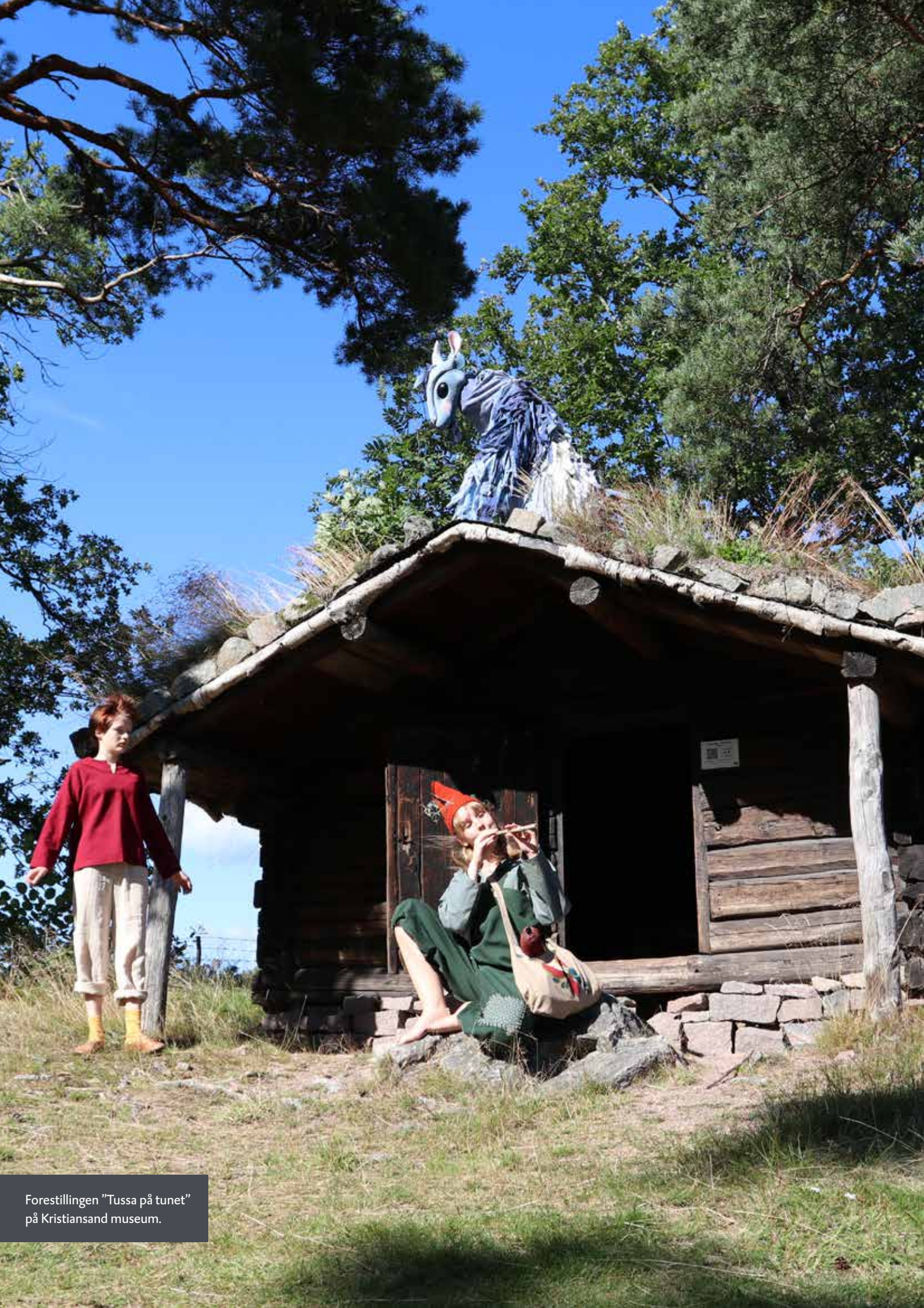
Forestillingen "Tussa på tunet" på Kristiansand museum.