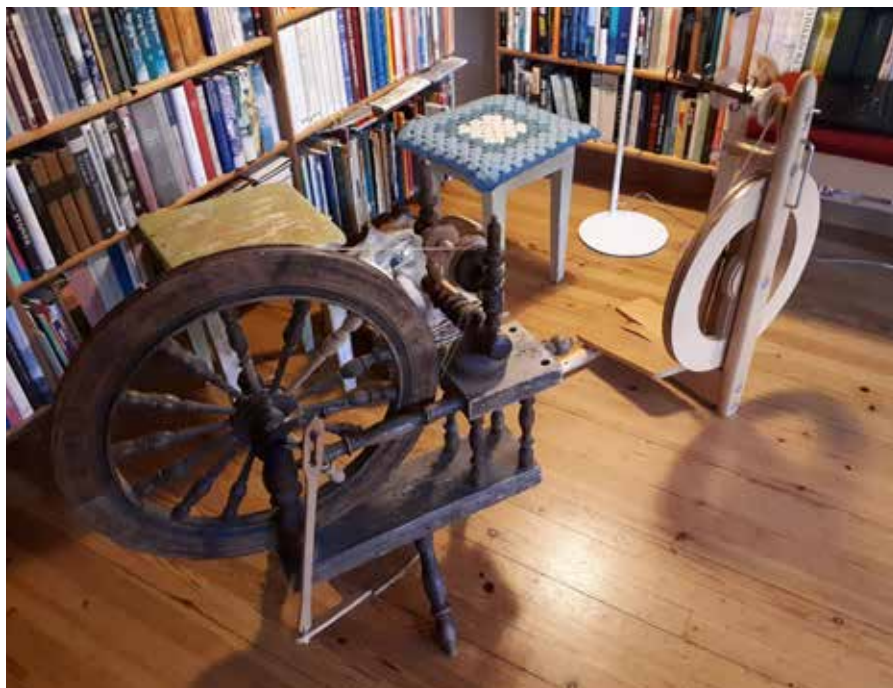
Digital spinnekveld på Sjølingstad, et arrangement i samarbeid med Sørlandsrokken.