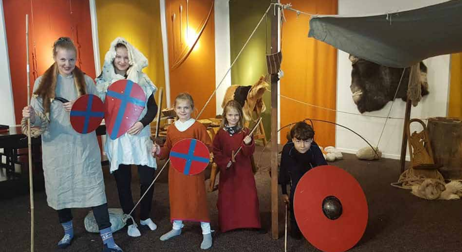
Høstaktiviteter på Lista museum.