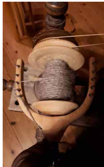
Resultat etter kvelden.