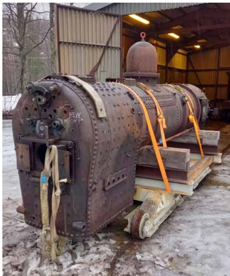
Kjelen til lok 2 er klartgjort for å sendes til England for full overhaling.