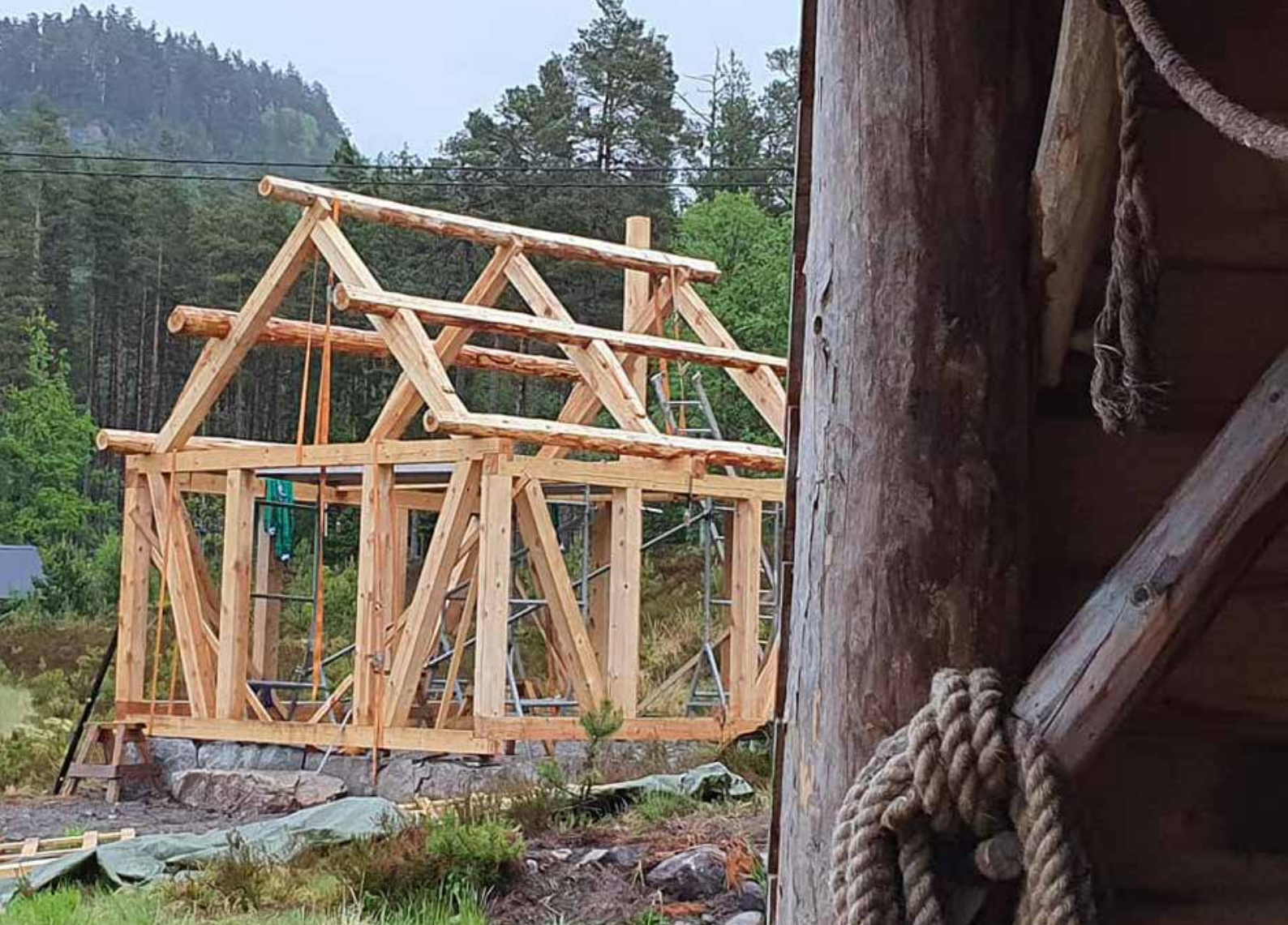
Tradisjonell byggeskikk vises fram på Tingvatn fornminnepark.