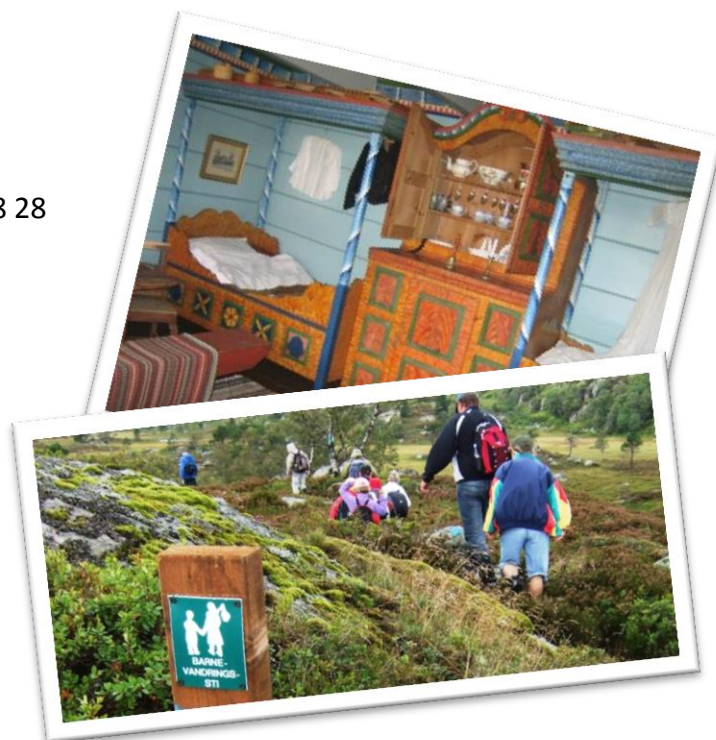
Det Gamle Posthuset og barnevandringstien.

Museet holder til i et gammelt våningshus og lensmannsgård fra 1750: fengsel og voksfigur av Ole Høyland, gammel bondestue og utstilling fra arbeidet på Sørlandsbanen m.m.