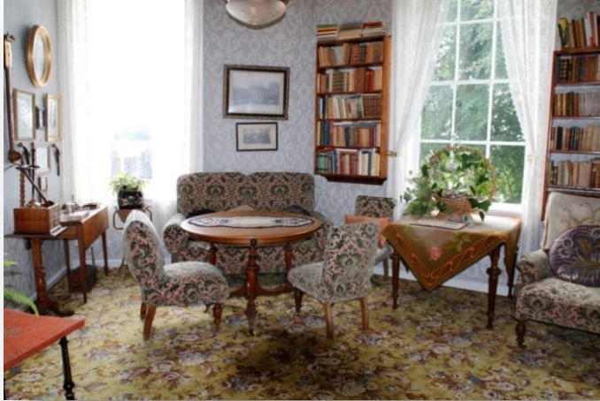
Interiør fra Gimle Gård herregårdsmuseum.

Omvisninger mellom august – november og mai – juni. Maks 25 personer i hver gruppe om ikke annet er avtalt.