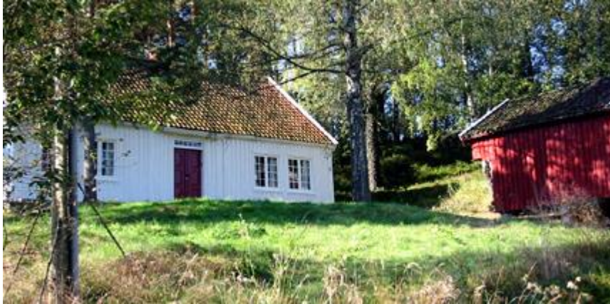
Vennesla skole- og bygdemuseum.

Lærere kan låne nøkkel til museene og selv veilede elevene i utstillingene. Det finnes ressurspersoner som har spesialkunnskap om enkelttemaer. Ta kontakt med kommunen for veiledning.