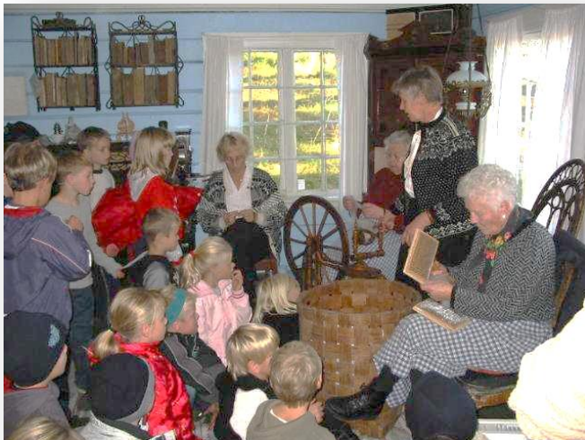
Den kulturelle skolesekken på bygdemuseet i Vennesla.

E-post: arnstein.haakonsen@vennesla.kommune.no