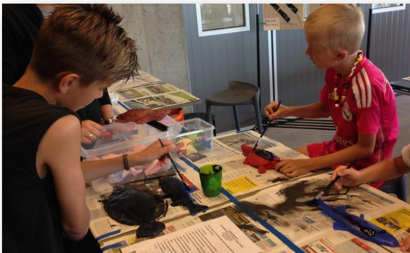
Fisketrykk i aktivitetshuset i Nodeviga.

Gratis for skoler og barnehager. Materialkostnader vil eventuelt komme i tillegg.