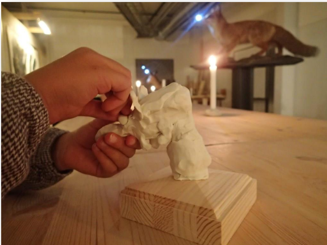
Modellering i verkstedet på Kulturtorvet.

Vi tilbyr aktiviteter for barnehager og ulike trinn i skolen. De fleste opplegga kan tilpasses. Eksempler på tilbud: Skattejakt i utstillingene, vikingtiden med omvisning og "vikinghåndverk", Gustav Vigeland med grafikkverksted, Arne N. Vigeland med arbeid i modelleire og eget krokiverksted.