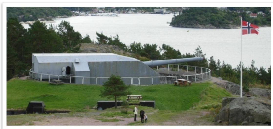
Verdens nest største kanon i flotte omgivelser på Møvig.