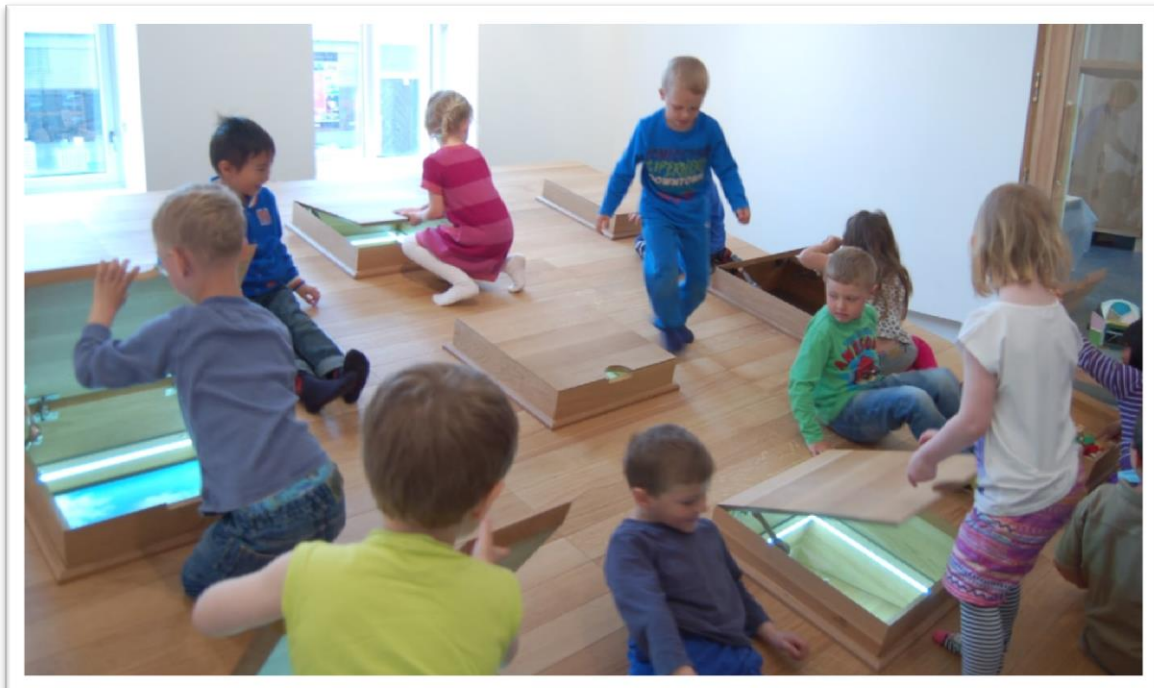
Aktivitet i Barnas Museum.

Skippergt. 24 b Postboks 662, 4666 Kristiansand tlf. 38 07 49 00 (sentralbord), www.skmu.no Kontaktperson: museumspedagog Marte Undheim tlf. 38 07 49 01, formidling@skmu.no www.skmu.no