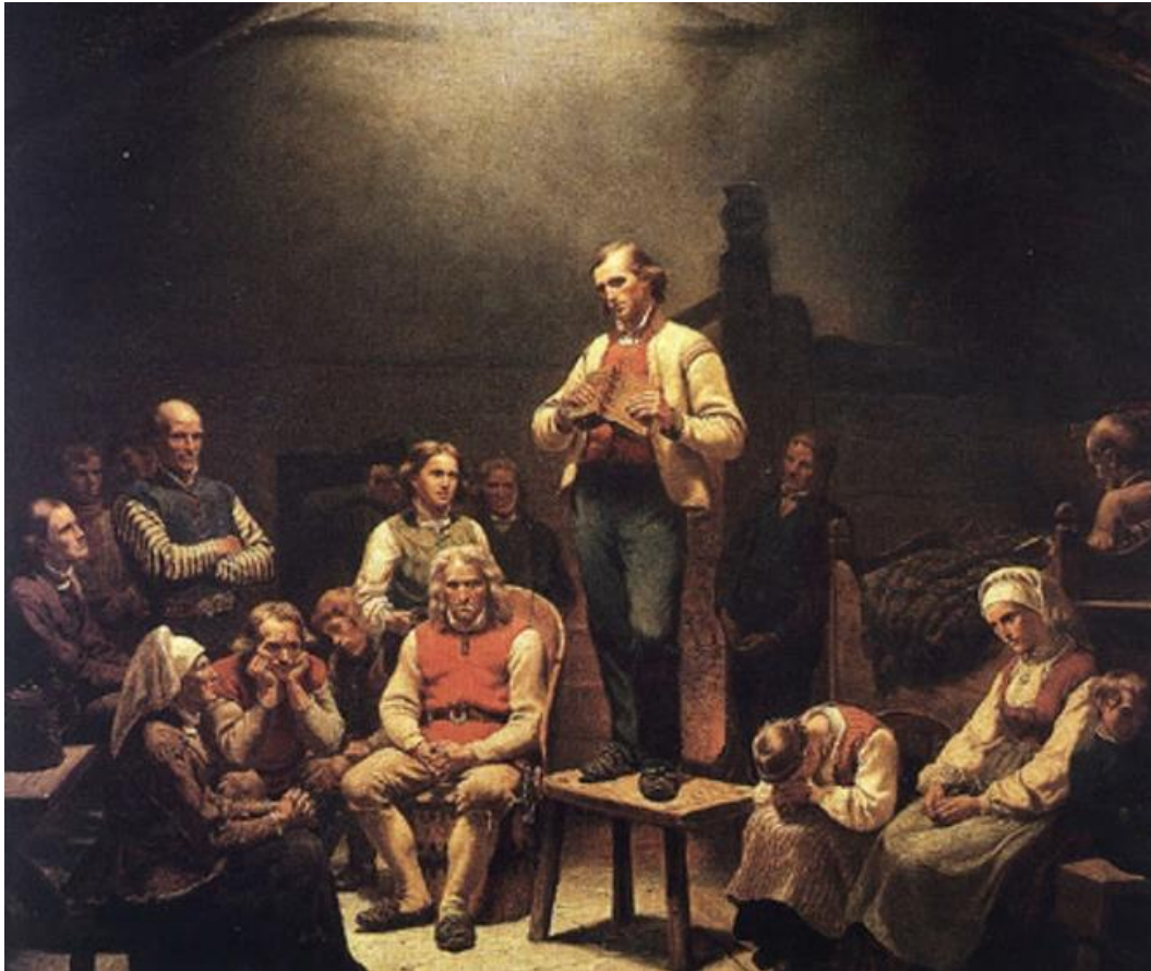
Adolph Tidemand, "Haugianerne", Mandal museum.

Tidemand i Mandal, Mandal – byen med de store kunstnerne, grafikkverksted, 2. verdenskrig med vandring til Uranienborg, sjøfartsbyen Mandal.