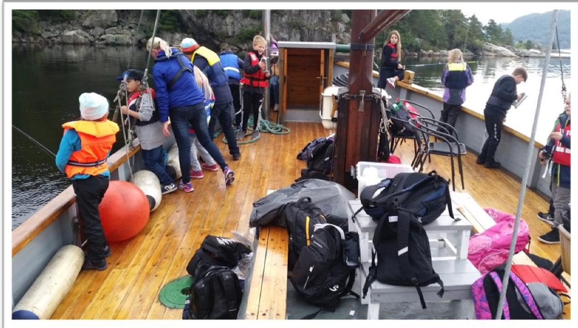
På tur med Solstrand.

I tillegg har museet en rekke skiftende utstillinger i løpet av året. Følg med på nettside og Facebook for oppdatert utstillingsprogram og undervisningstilbud.