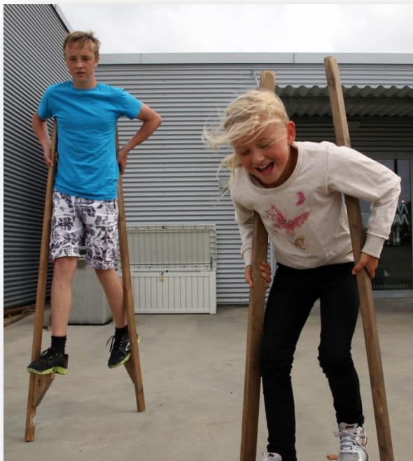
Mange aktiviteter på Nordberg fort.

www.vestagdermuseum.no/lista Følg oss på: facebook.com/nordbergfort