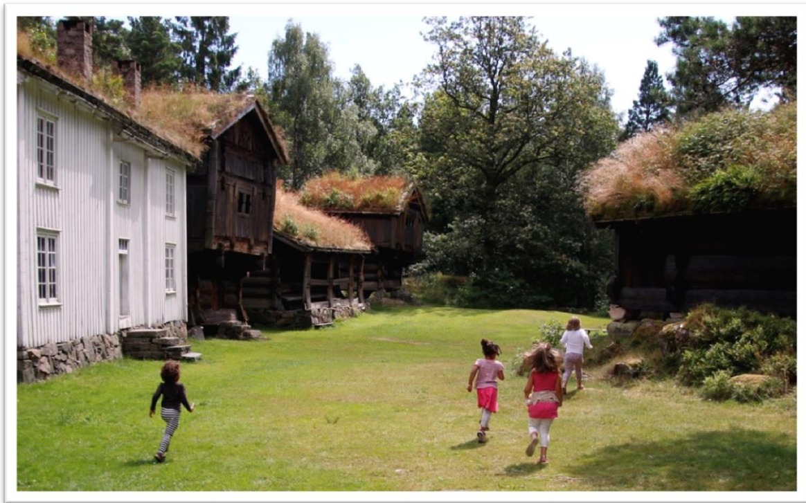
Fra Setesdalstunet.

I den gamle skolestuen fra Upsaker i Holum leker vi gammeldags skole. I sjøfartsavdeling forteller vi om seilskutetiden i Kristiansand. En "hjemmefronthytte" gir et bilde av Norge under 2. verdenskrig, oppført under regnfulle vinterdager i 1942 og gjemmede for mange mennesker på flukt. Museet har også et prakt eksempar av rosemalingskunst, et lite hus fra Tonstad i Sirdal med rosemalt interiør. Minibyggerne, en gruppe av byens ivrige pensjonister, fortsetter å fylle Minibyen med hus fra Kvadraturen i størrelse 1:10.