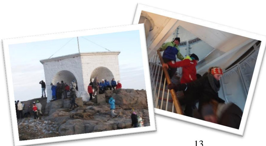
Den kulturelle skolesekken på Lindesnes fyr.

Legg et besøk til Norges sydspiss og Lindesnes fyr, Norges første fyrstasjon. Lindesnes fyrmuseum er en del av Kystverkmusea og tilbyr formidling innen temaene kystkultur, fyrhistorie, meteorologi og navigasjon. Museet er også ansvarlig for tjenesten www.kystreise.no . Lindesnes fyr ligger i et naturskjønt landskap. Området byr på oppmerkede turstier og spennende naturoplevelser.