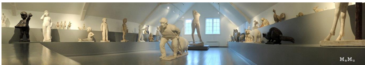
Sigurd Nomes skulptursamling på Høgtun i Marnardal.

■ Mjålandsstova er Vest-Agders eneste bevarte rosemalte bondestove. I årestova fra ca. 1600 legges det til rette for eventyrstund for de yngste klassetrinnene.