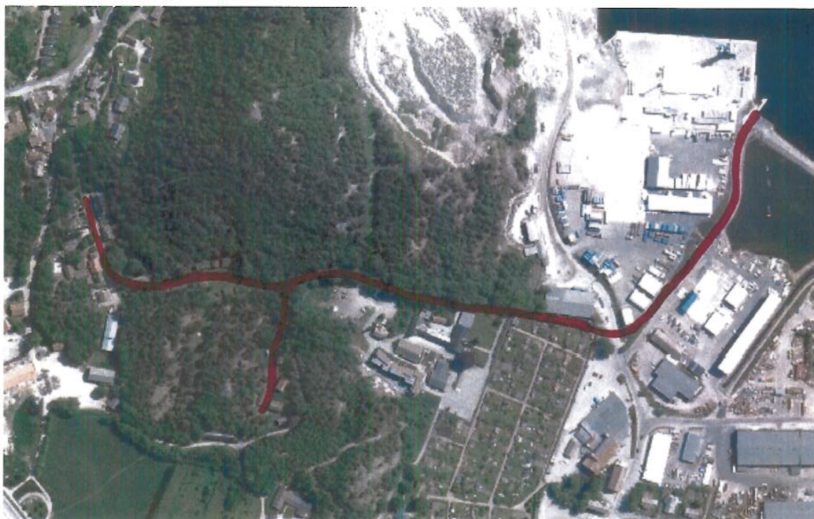
Vest-Agder Museet. Transporttrase merket med rødt