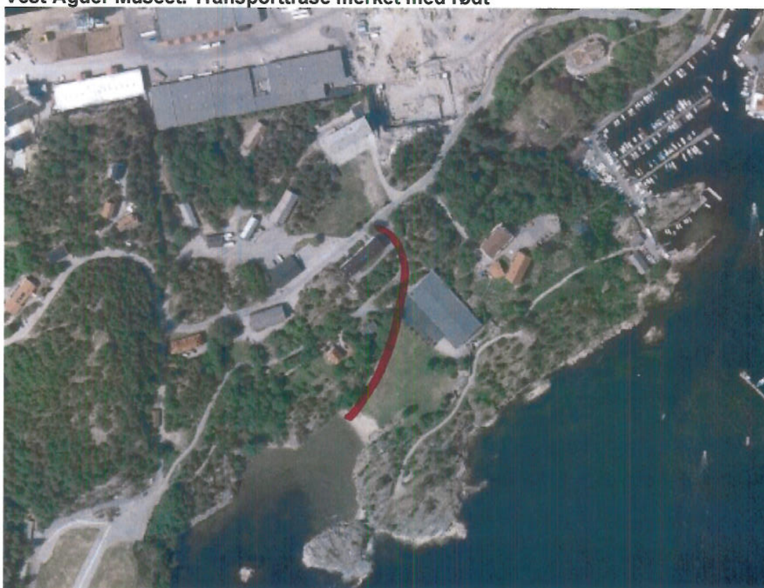
Odderøya. Transporttrase merket med rødt