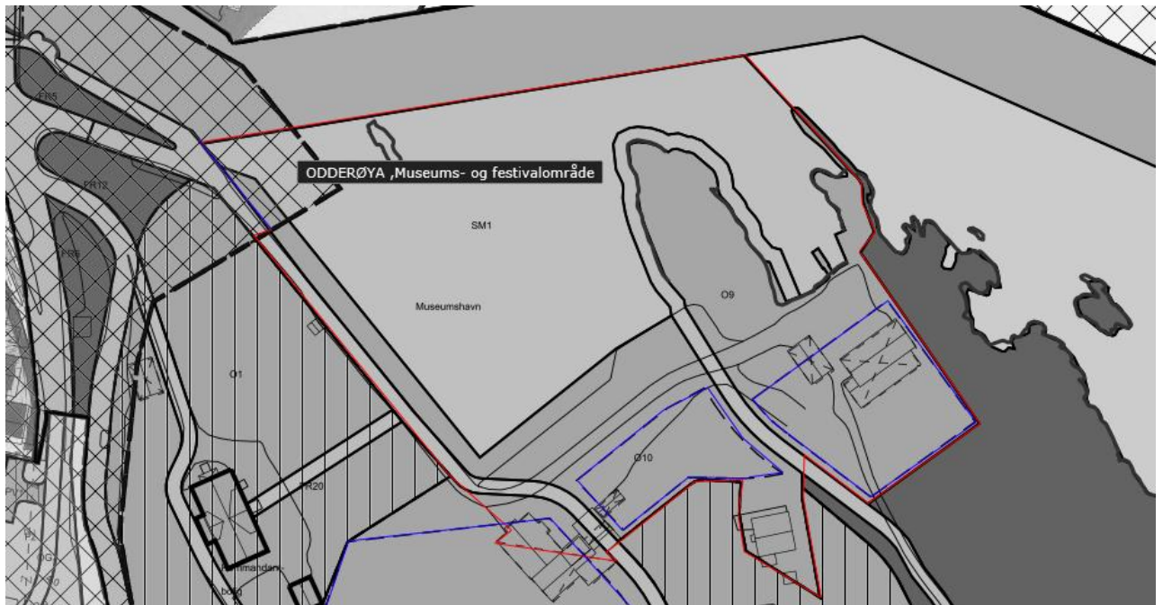
Figur 1 Røde linjer markerer avgrensning for prosjektområde. Blå linjer viser areal hvor bebyggelse i tråd med reguleringsplanen er tillatt.