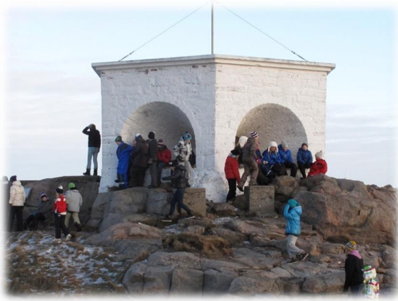
Den kulturelle skolesekken på Lindesnes fyr.