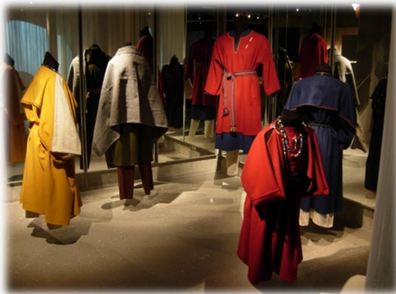
Fra utstillinga Augandzi – Agder i trollspegelen .

Det vert opna ein splitter ny butikk med tradisjonskunst frå heile Agder, og meir til, på Minne laurdag 30. november.