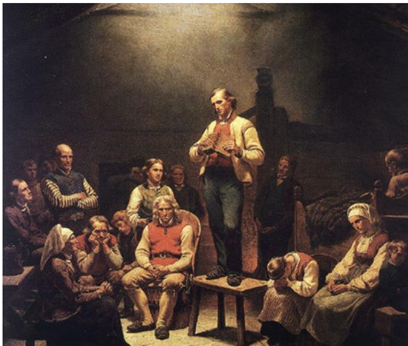
Adolph Tidemand, "Haugianerne", Mandal museum.