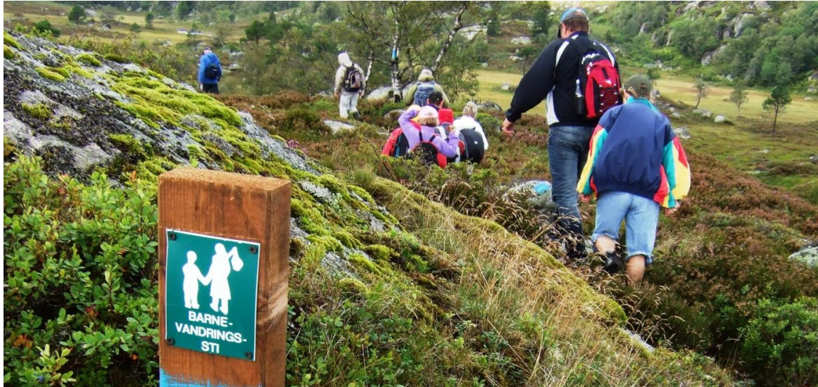
Fra barnevandringsstien.