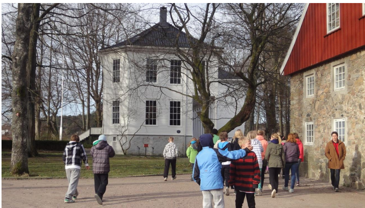
Gimle Gård herregårdsmuseum.

I gamle dager hadde folk flest stue og kjøkken og kanskje et kammers til soverom. Noen få hadde mer, store saler og spisestuer og soverom med høyt under taket. Men kjøkkenet lå kanskje i kjelleren. Slik som i det store herskapelige Gimle Gård. Vi viser dere hvordan det så ut hjemme hos familien Holm-Arenfeldt-Omdal fra 1797 frem til 1982. Bygningen har vært museum siden i 1985. Omvisning av grupper bestående av maks 25 personer om gangen (da er det fullt!)