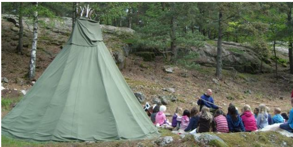
Skoleklasse er "Jegere i steinalderen" på Kristiansand museum.