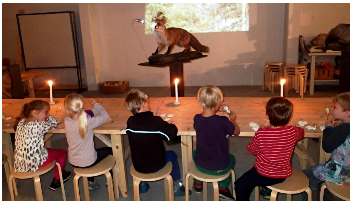
Dyr og dyreskulpturer: verkstedsaktivitet på Kulturtorvet.

Skoleklasser, SFO og barnehager kommer gratis inn på museet. Eventuelt undervisningsmaterieell må imidlertid skoler utenfor kommunen dekke selv.