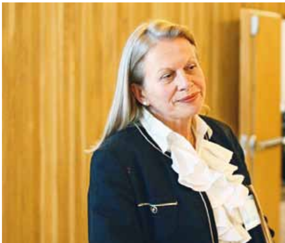
Janne Haaland Matlary.