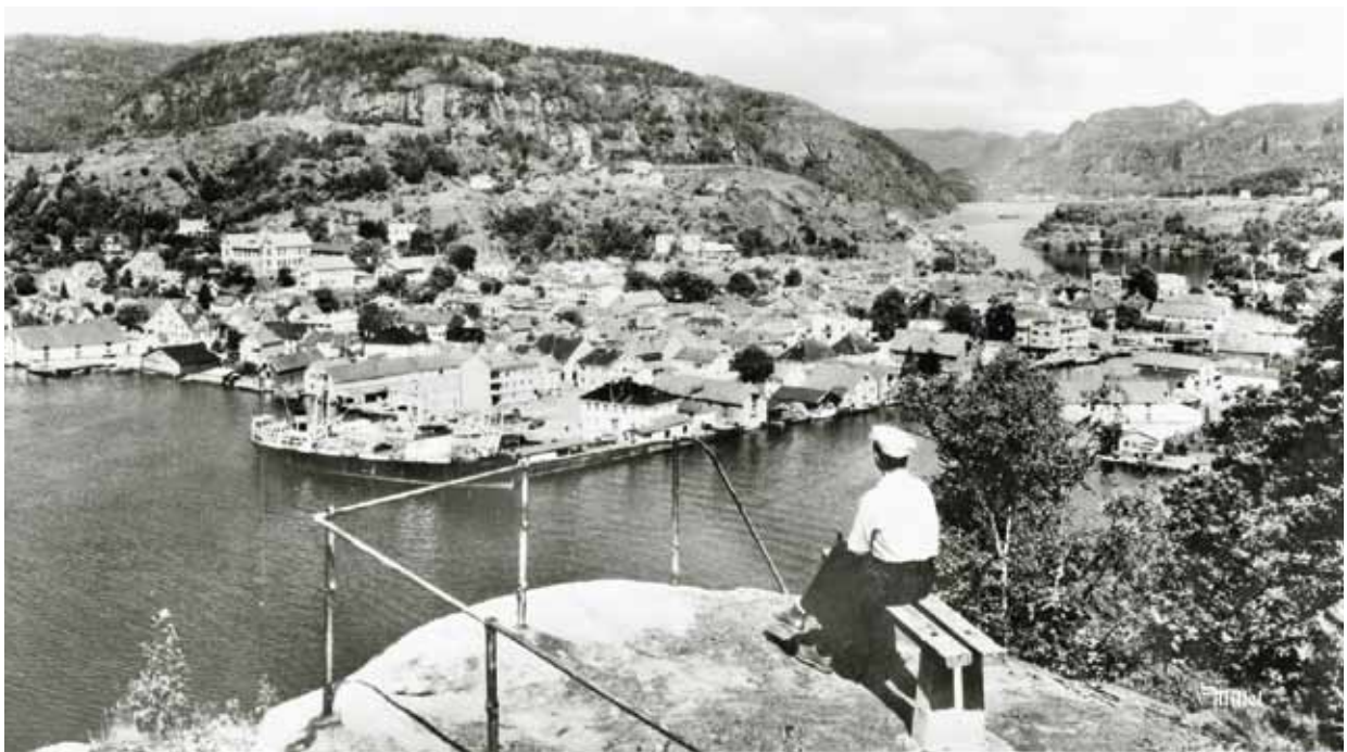
Flekkefjord ca. 1950.