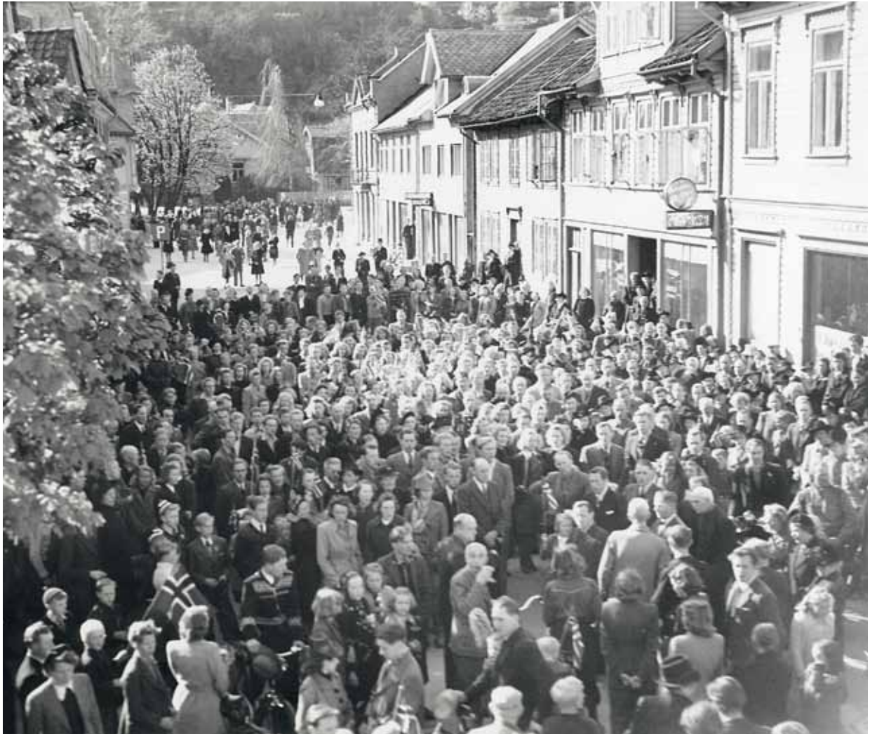
Fredsbudskapet leses opp på Lunden.