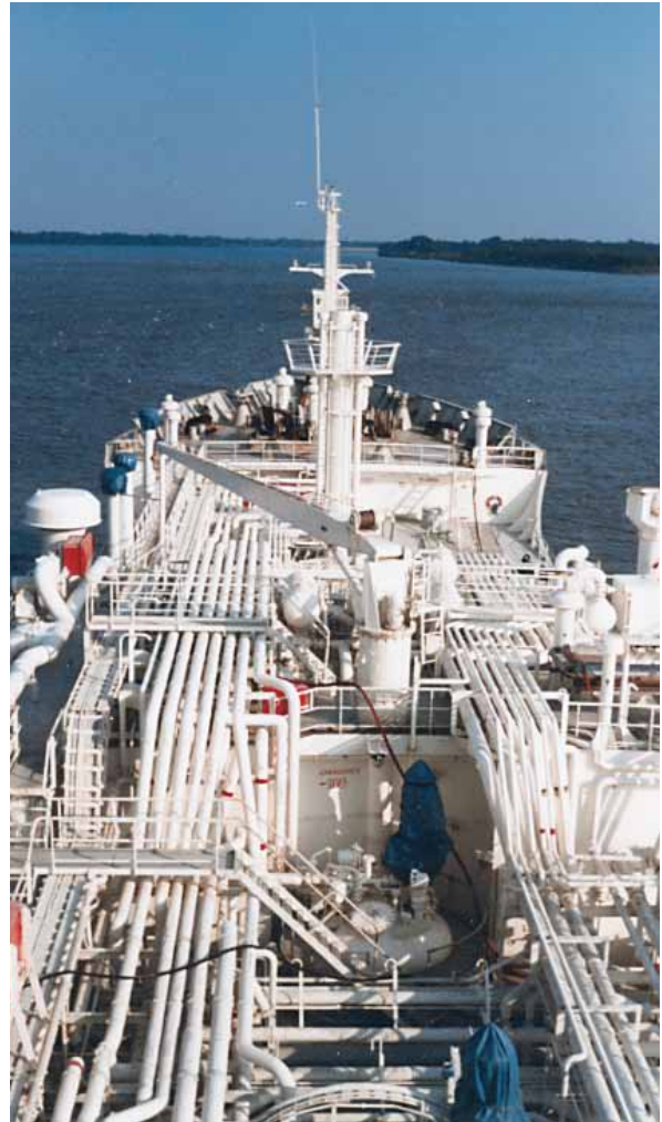
Fra broen på Helios .

Hun snakket hele tiden om å reise til sjøs. Tiden i Amerika hadde gitt henne lyst til å bli sjømann. Ingen tok henne på alvor når hun fortalte om sine