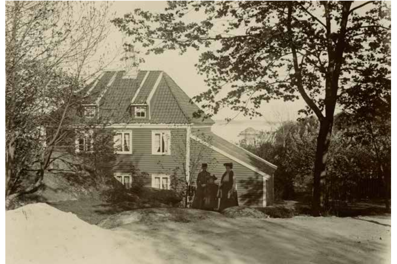
Karanteneinspektørens hus på Odderøya rundt år 1900. Det lå omtrent der idrettshallen ligger i 2012. Den siste karanteneinspektøren bodde i boligen frem til 1914.