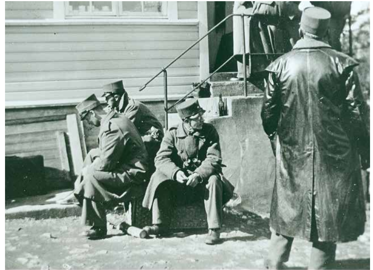
Noen av de norske soldatene som ble tatt til fange etter kampene den 9. april 1940, utenfor sykestua på Odderøya.