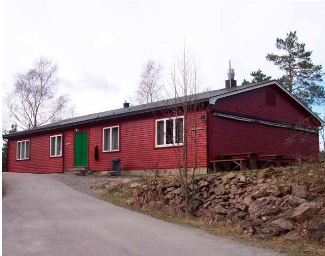
Østre brakke i 2012. Brakken disponeres av Odderøyas Venner.