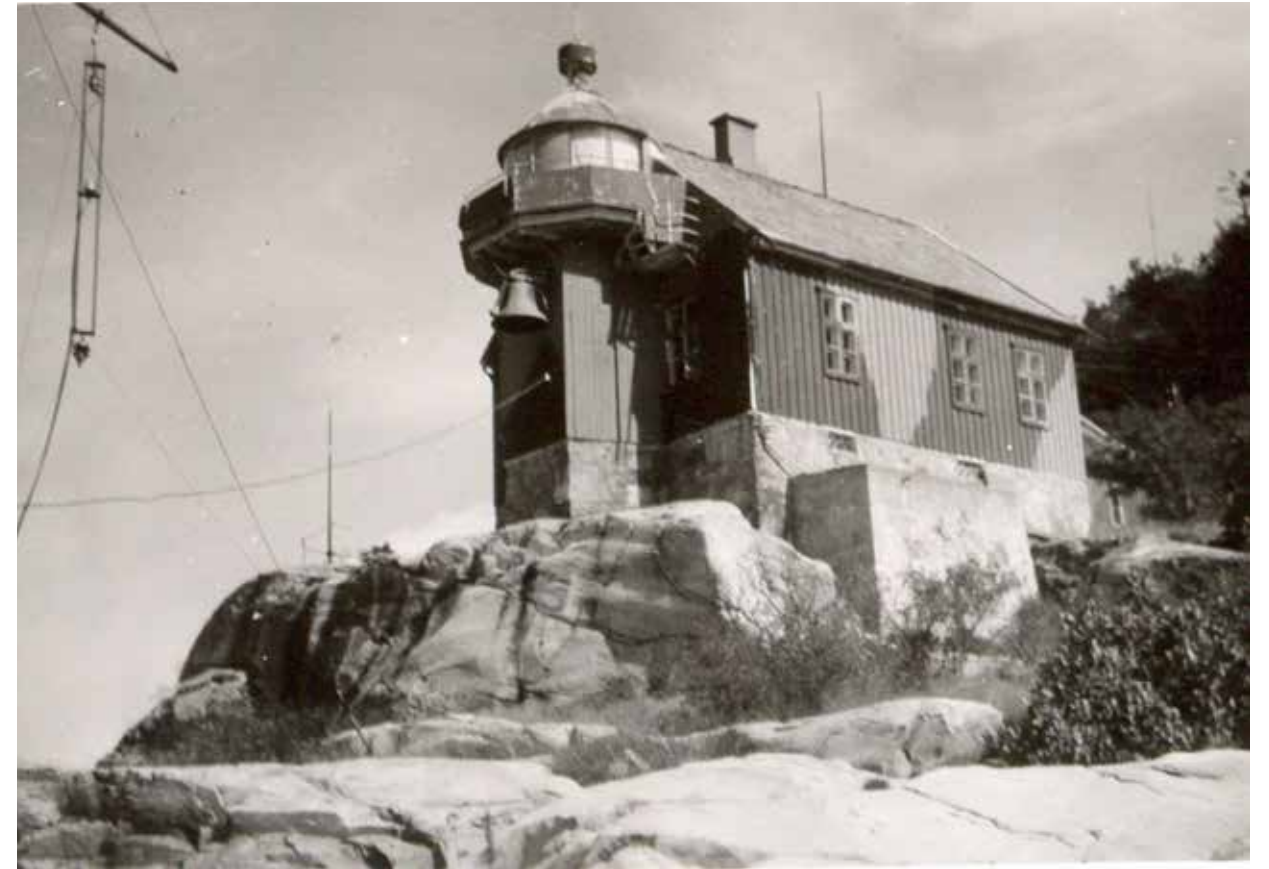
Odderøya fyr i mai 1945. Etter krigsutbruddet i 1939 ble malere satt til å kamuflasjemale fyrene langs sørlandskysten.