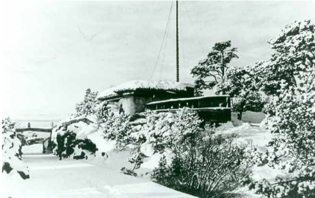
Hovedkommandoplassen på Odderøya ble bygd av entreprenørfirmaet Høyer-Ellefsen A/S i 1913-14 og kostet 8 600 kroner.