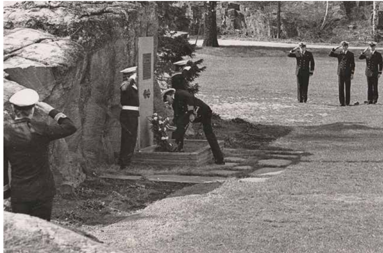
Minnestøtten over de åtte som falt på Odderøya den 9. april 1940 stod helt frem til 2007 på paradeplassen. Den 8. mai 1985 var det 40 år siden "freden brøt ut", og dette ble markert med parade og blomsternedleggelse ved minnestøtten.