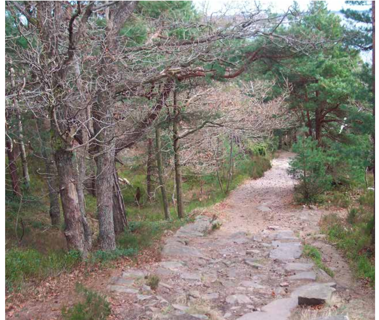
Viljebakken i 2012.