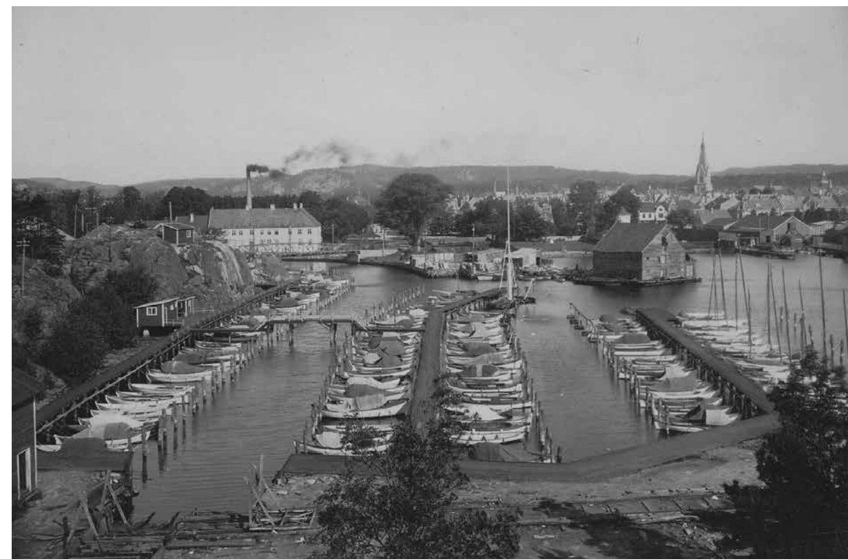
Nodeviga i år 1930. Det er trangt om plassen i båthavnen. Legg merke til broen mellom bryggene til venstre. På samme side ses den gamle svingbroen over Gravenekanalene.