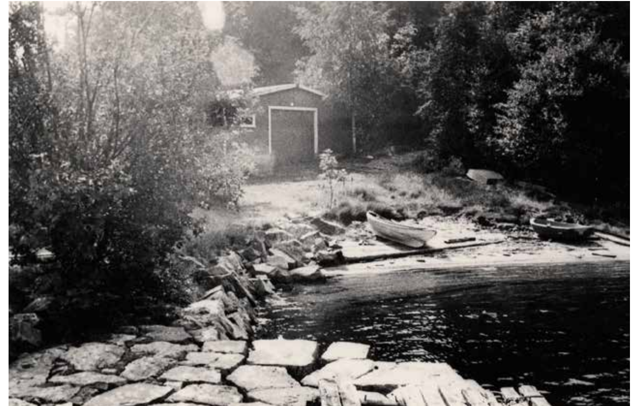
Kjerregårdsbukten i den perioden da Skyteskolen hadde et båthus på muren som omsluttet den tidligere kolerakirkegården. I forgrunnen ser vi den gamle steinbryggen som hadde betegnelsen Daumannsbryggen.

fritt for alle, og det skal være et sted der livsgleden dominerer. Odderøyas Venner arbeider også med å ivareta øyas grønne områder og utvikle den stedege fauna og flora. I tillegg ønsker de å være en ressursgruppe som offentlige myndigheter og andre kan forholde seg til og samarbeide med. Østre brakke leies ut til private arrangementer gjennom Odderøyas Venner.