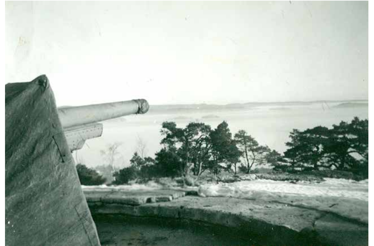
En 10,5 cm kanon på Mellombatteriet like etter andre verdenskrig.