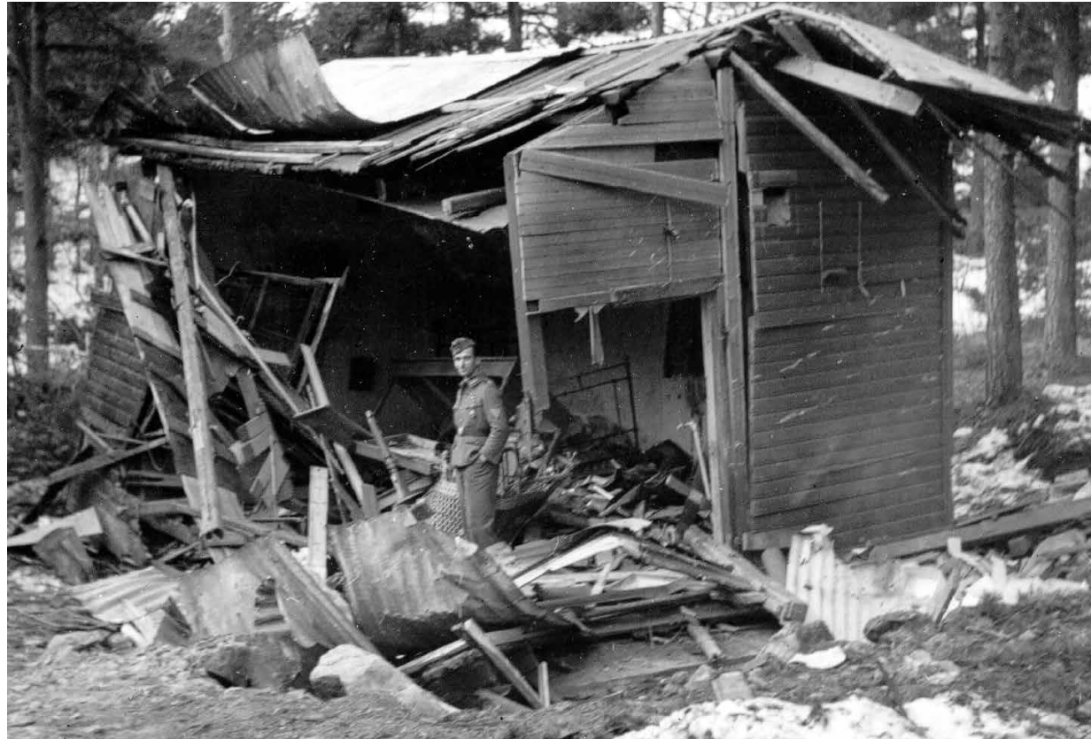
Da ammunisjonslageret på Odderøya eksploderte den 9. april 1940, ble det store skader på flere bygninger. Skadene ble enten forårsaket av granater fra de tyske krigsskipene eller av lufttrykket da ammunisjonslageret eksploderte.