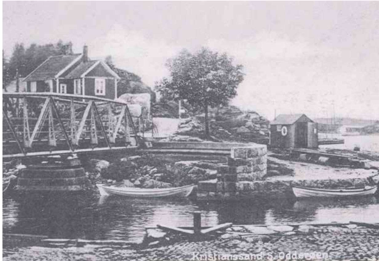
Odderøybroen og brovokterens hus etter 1905. Her ser vi tydelig svingmekanismen til den første broen mellom Kvadraturen og Odderøya. De store steinfundamentene til broen ligger fremdeles i kanalen.