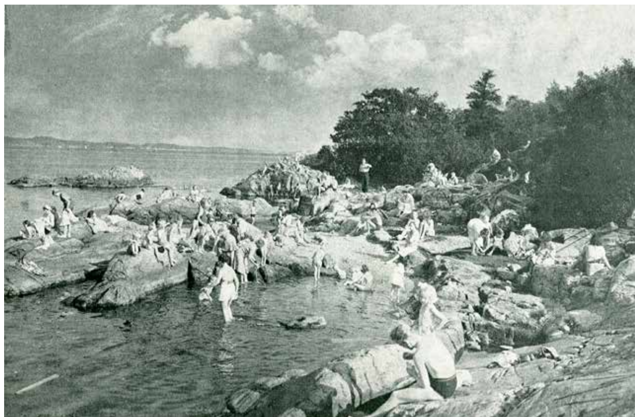
Sommeraktivitet i Lille Nodeviga på 1950-tallet. Den bynære badestranden var på den tiden et yndet utfartsmål for både små og store kristiansandere.