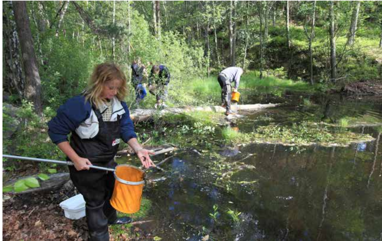
Småsalamanderen er egentlig et landdyr som oppsøker dammer og tjern om våren for å formere seg. I parringstiden har salamanderen utviklet flotte farger og "svømmekam" på hale og rygg.