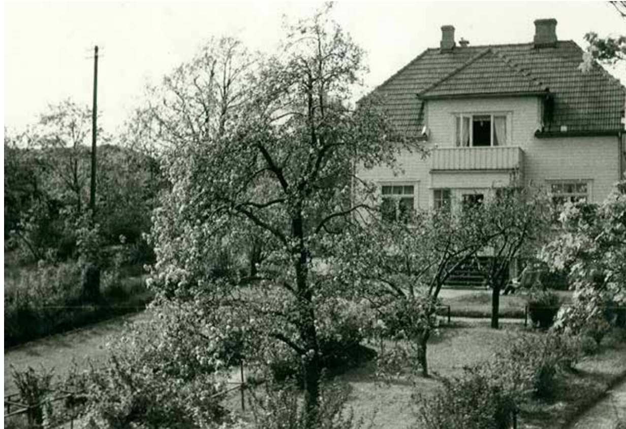
Det er fremdeles mulig å se spor etter den frodige hagen som omgav den tidligere vollmesterboligen som i 2012 omtales som Artpilot-bygningen.