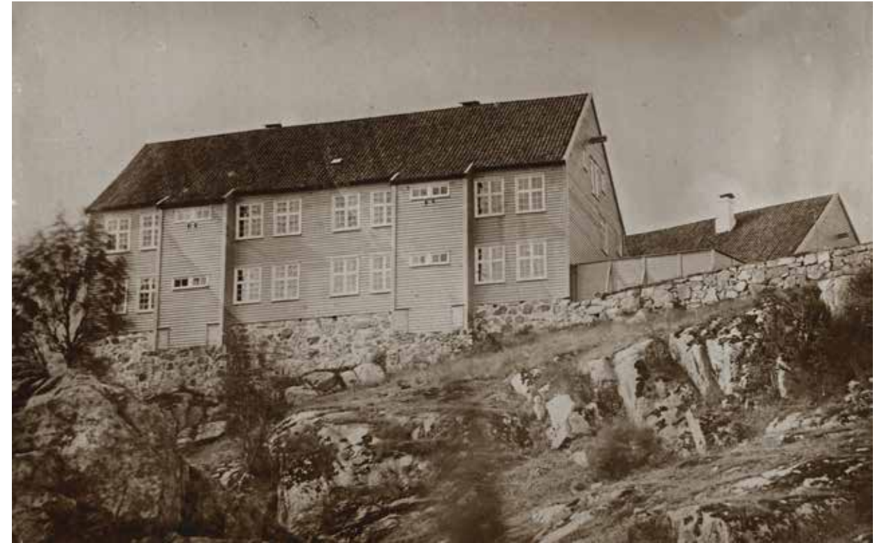
Lasarettene sett fra øst på begynnelsen av 1900-tallet. De to store bygningene ble satt opp med laftede tømmervegger, mens pakkhusene ble bygd i bindingsverk. De to lasarettbygningene er synlige over store deler av byen.