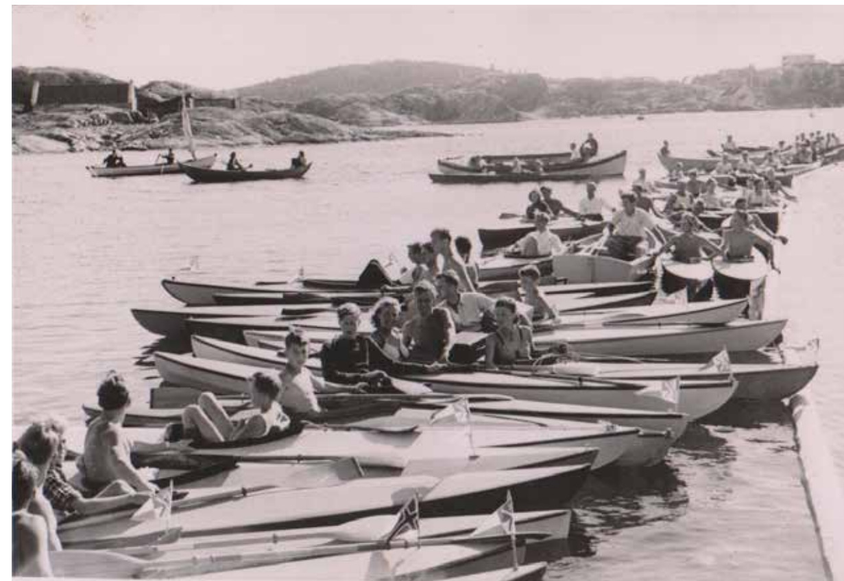
Kajakkpadlere på 1930-tallet.