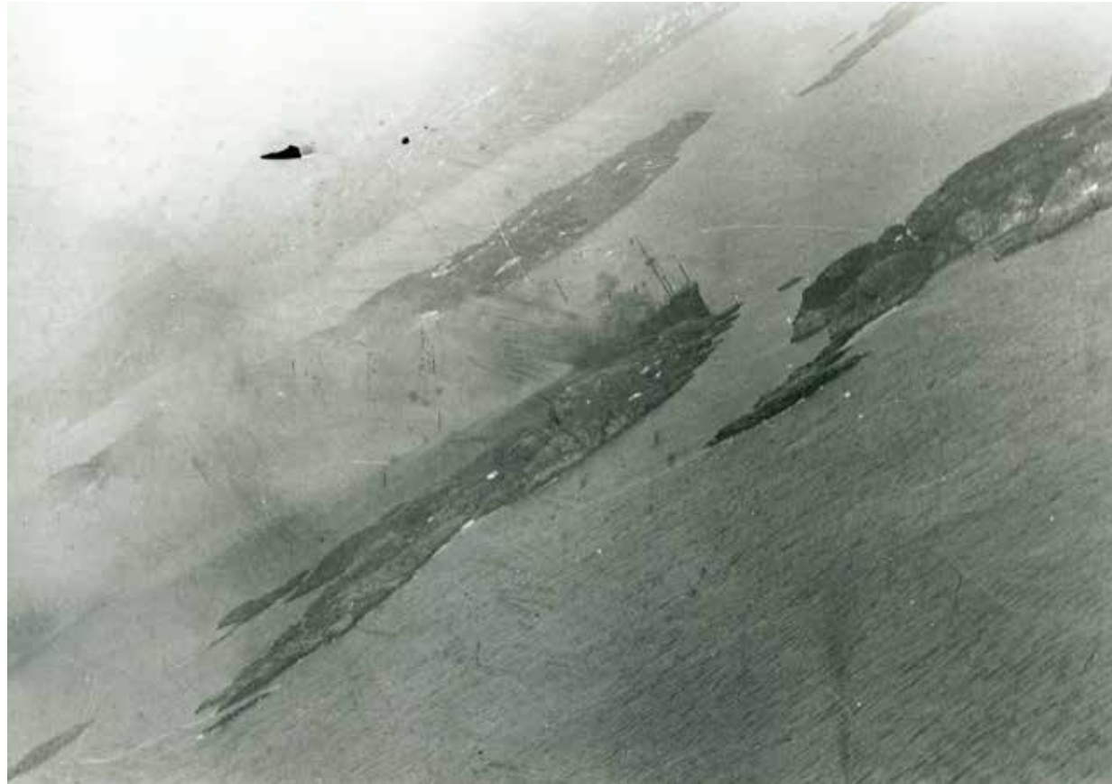
Et tysk bombefly fotografere lasteskipet "Seattle" den 9. april 1940 etter at det er truffet av granater fra Vestre batteri på Odderøya.